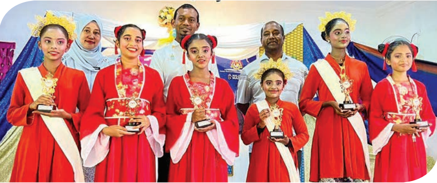
வட செபராங் பிறை மாவட்ட அளவில் அறநெறி கல்வி கர்னிவலில் வெற்றிப்பெற்ற மாணவர்களுக்கு பாகான் டாலாம் சட்டமன்ற உறுப்பினர் குமரன் கிருஷ்ணன் பரிசுகளை எடுத்து வழங்கினார்.