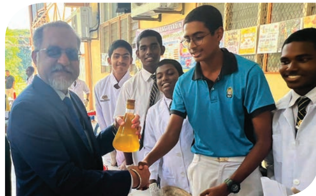
பள்ளிகளில் அறிவியல், தொழில்நுட்பம், பொறியியல் மற்றும் கணிதத் திட்டங்களை தொடர்ந்து ஊக்குவிக்கும் வகையில் இரண்டாம் துணை முதலமைச்சர் ஜக்டிப் சிங் டியோ ஸ்தெம் மாதக் கொண்டாட்டத்தில் கலந்து கொண்டு மாணவர்களுக்கு ஊக்கமளித்தார்.