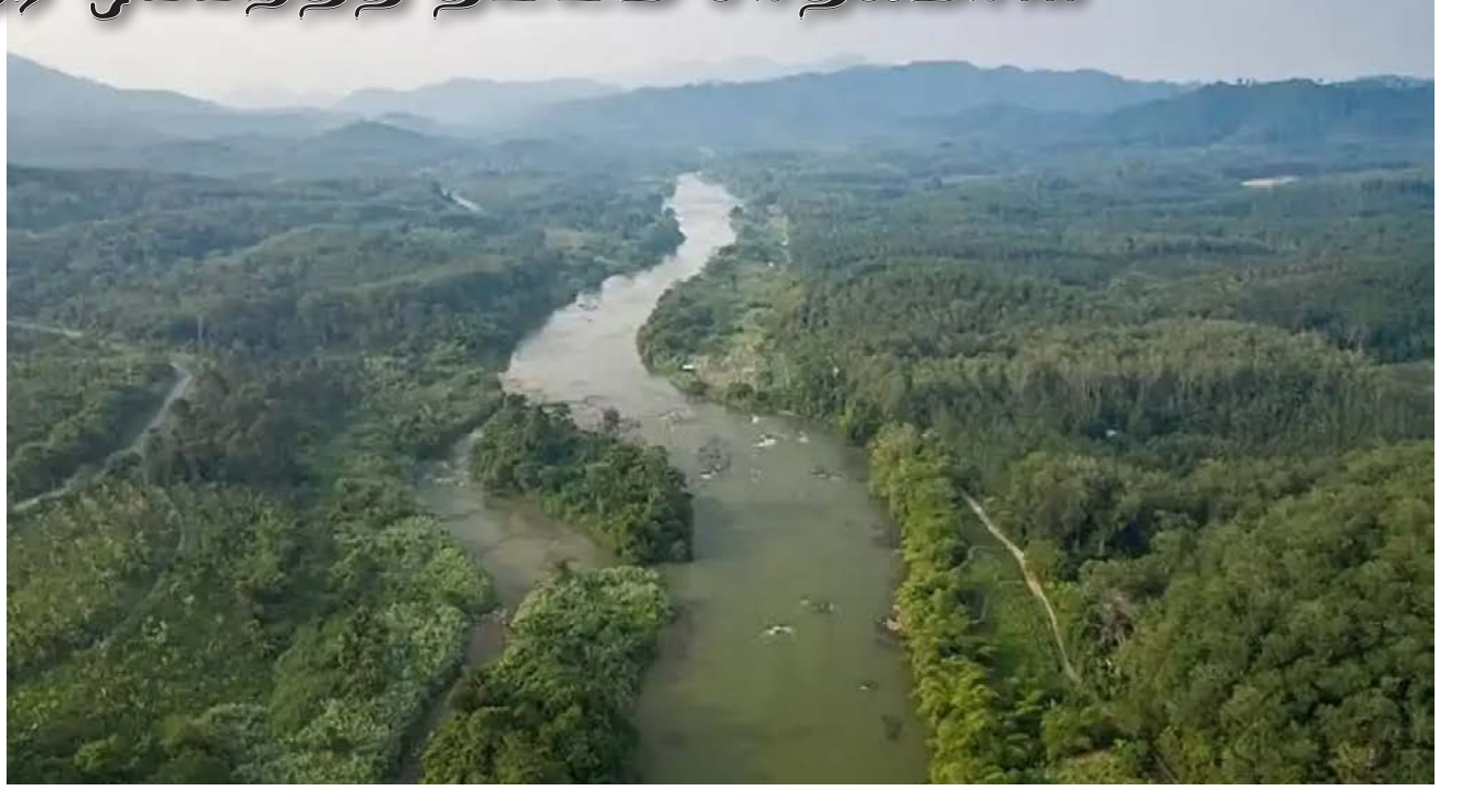
பேராக்க பீனாங்கு நீர் திட்டம் பேராக்க நதியிலிருந்து புக்கிட் மேரா அணைக்கு மூல நீரைக் கொண்டு செல்லும் (மூலம்: இணையதளம்).

"பீனாங்கு பெற வேண்டிய சரியான நீரின் அளவு குறித்து இன்னும் பேச்சுவார்த்தை நடத்தி வருகிறோம்.