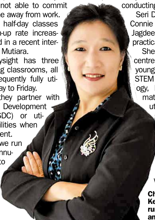
Cheong: On average Keysight Technologies runs 300 classes annually.

"Offering incentives to stakeholders who establish these centres and actively promote STEM among young women is crucial.