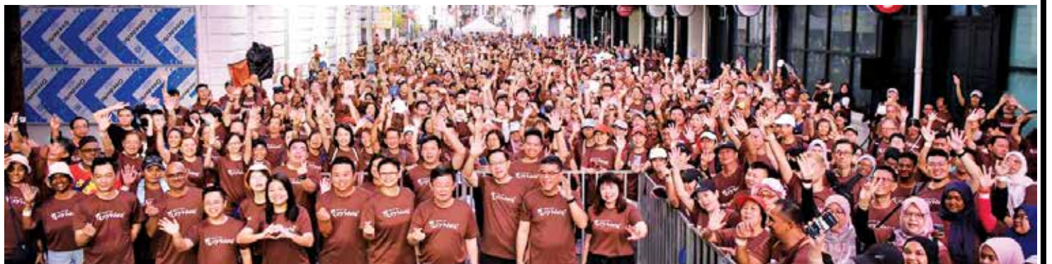
来自17个国家，共1500人齐聚古迹区欢乐步行。

来自17个国家，共1500人欢乐齐聚古迹区，朝气参与城市行，共同欢庆乔治市世界遗产日16周年！