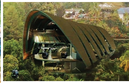
பினாங்கு கொடிமலை கேபில் கார் திட்டத்தின் கட்டுமான பணிகள் தொடக்கம் கண்டது.