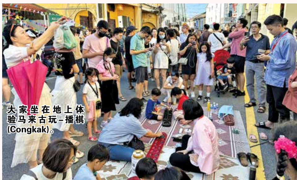
大家坐在地上体验马来古玩-播棋(Congkak)。