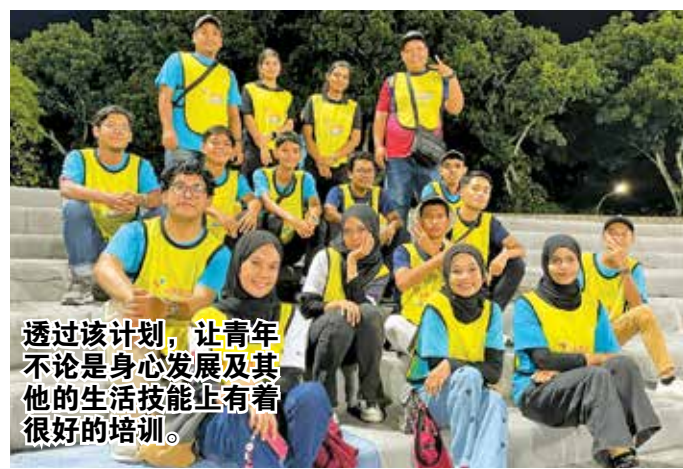
透过该计划，让青年不论是身心发展及其他的生活技能上有着很好的培训。