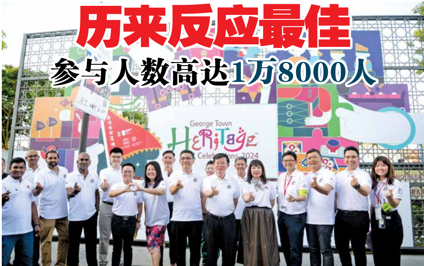
乔治市入遗庆典迈入16年，槟首长曹观友及一众嘉宾齐出席，与民同乐！