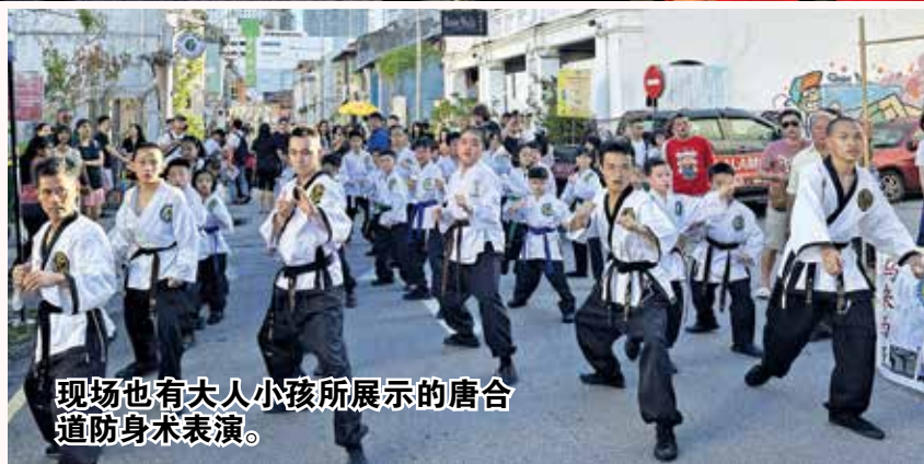
现场也有大人小孩所展示的唐合道防身术表演。

他相信在槟城乔治市机构协助与大家共同努力下，槟州在维护古迹方面可以做得更好，让更多人认识槟城的古迹及人文文化，并继续守护槟城古迹在联合国文化遗产名录的荣誉。