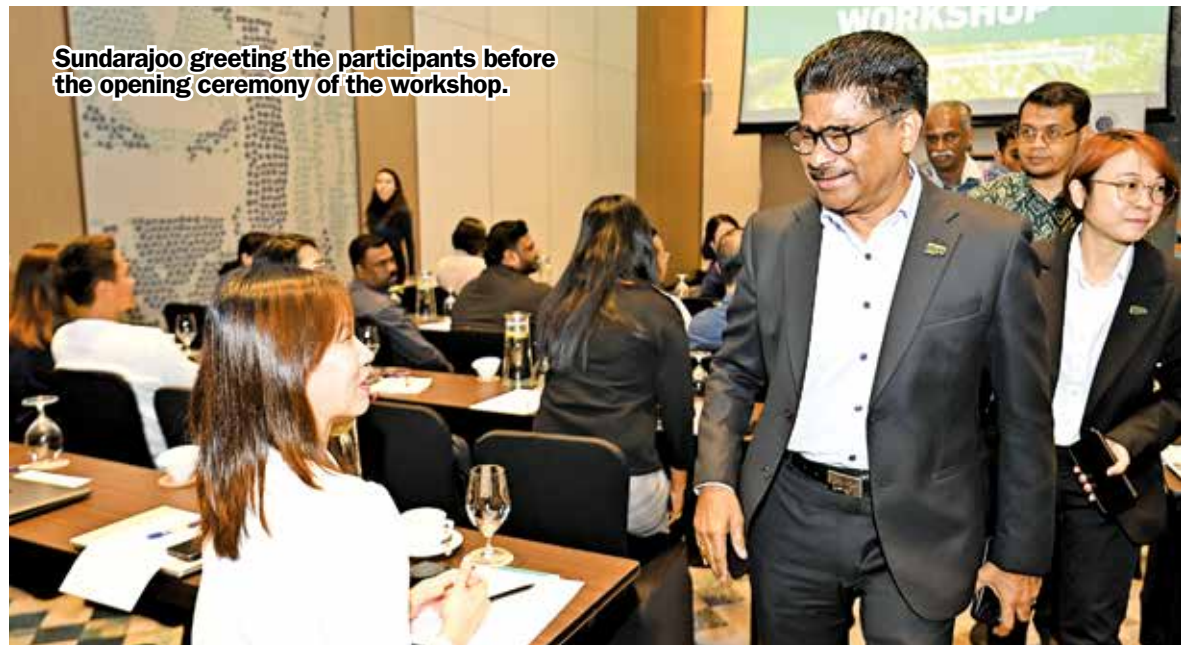
Sundarajoo greeting the participants before the opening ceremony of the workshop.

Hosted by the United Nations Global Compact Malaysia and Brunei (UNGCMYB) in collaboration with Penang Green Council