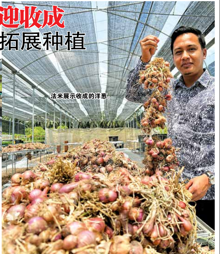
法米展示收成的洋葱。