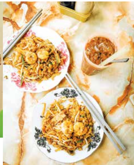
炒粿条是槟城特色美食之一。