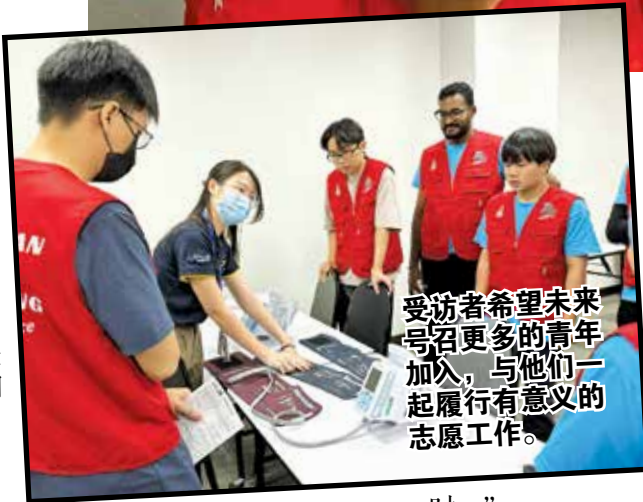
受访者希望未来号召更多的青年加入，与他们一起履行有意义的志愿工作。