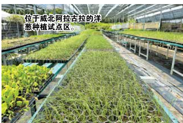
位于威北阿拉古拉的洋葱种植试点区。

不过，种植洋葱的过程并不容易，尤其变化无穷的天气可能会导致收成受影响，因为葱需在乾燥环境中才能健康成