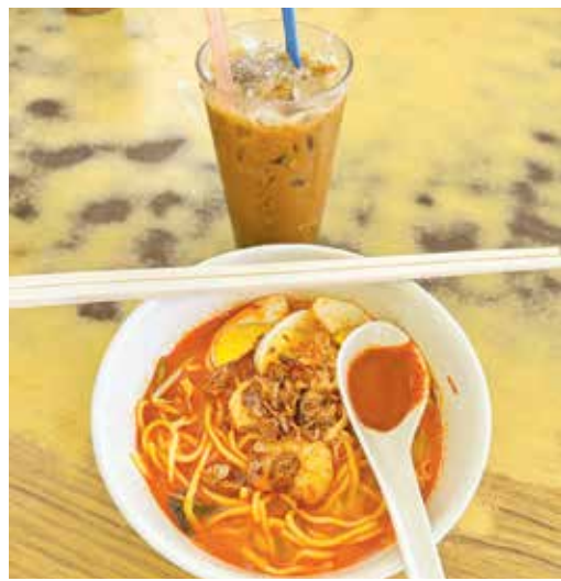
本地人或游客爱吃的槟城福建面。

槟岛市政厅计划明年起把“禁止外劳掌厨”政策，扩大至私人经营的咖啡店及饮食中心，其中禁止外劳烹煮13道槟城特色美食，需由本地人掌厨！