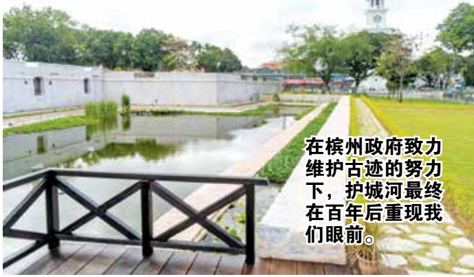
在槟州政府致力维护古迹的努力下，护城河最终在百年后重现我们眼前。

包括康华丽堡内部10间仓库已完成修复，并会作为博物馆，陈列出英殖民时代及槟榔屿早期珍贵历史物件。