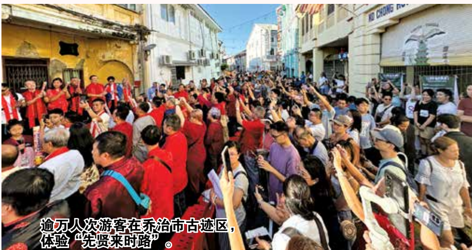
逾万人次游客在乔治市古迹区，体验“先贤来时路”。

日，能让民众有机会聆听早期历史故事，并怀着感恩的心，走过先贤在槟州的心路历程，并从他们故事中获得启迪和力量。