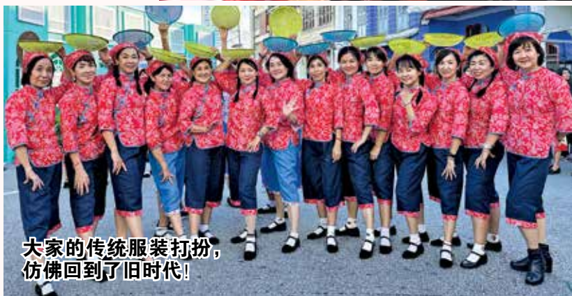
大家的传统服装打扮，仿佛回到了旧时代！