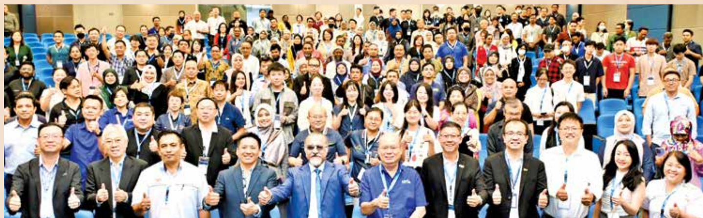
槟城英特尔主办为期两天的“大学人工智能”培训工作坊，反应热烈。

为期两天的工作坊是由英特尔主办，并由88 Captains、槟城圆顶科技馆(Tech Dome Penang)、GOTT、华擎(ASRock)和IMAGINE AI支持，此活动也是英特尔公司致力于推动最高水平AI教育的承诺。