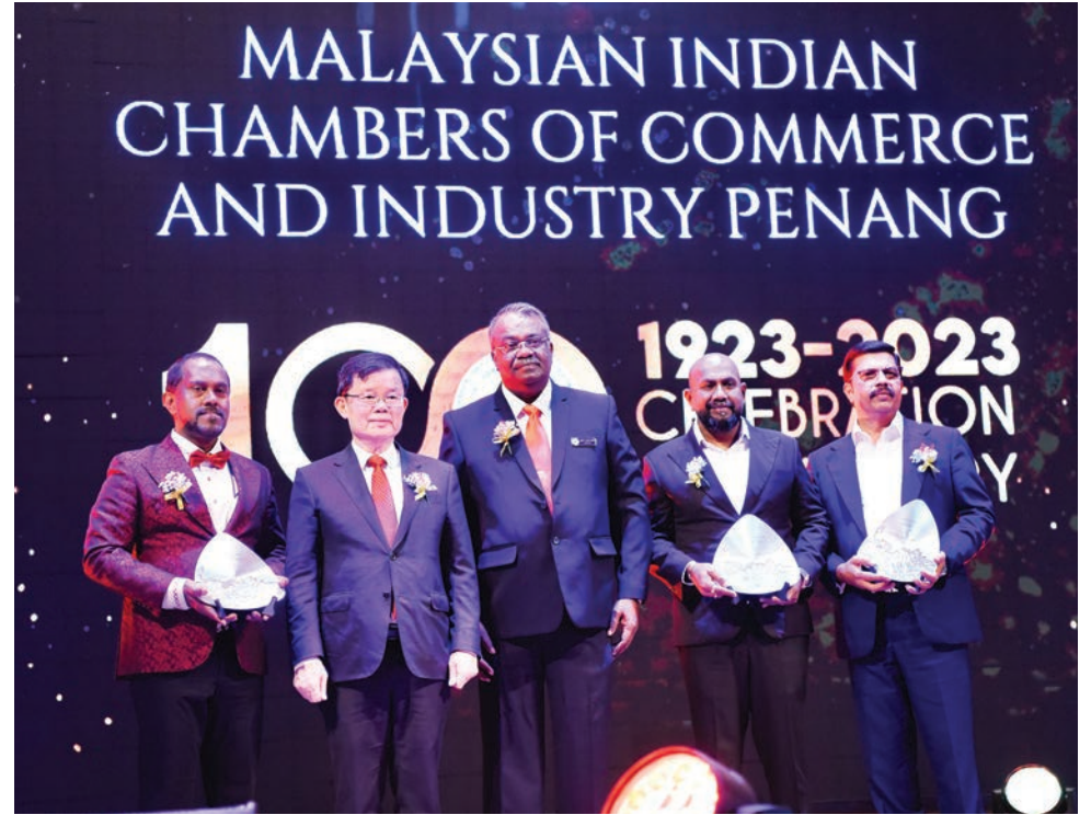
மாநில முதலமைச்சர் சாவ் கொன் இயோவ் மலேசிய தேசிய வணிக விருது மற்றும் சிறந்த தொழில்முனைவோர் விருது பெறுநர்களுக்கு விருதுகளை வழங்கினார் (உடன் பினாங்கு இந்தியர் வர்த்தக மற்றும் தொழிலியல் சங்கம் தலைவர் டத்தோ எஸ்.பார்த்திபன்).

பினாங்கு நிலப்பரப்பில் இருக்கும் எங்கள் சங்க உறுப்பினர்களுக்கு சிறந்த சேவை வழங்கும் நோக்கத்தில் வடக்கு செபராங் பிறை மாவட்டத்தில் புதிய அலுவலக கட்டிடம் ஒன்றை வாங்க திட்டமிட்டுள்ளோம் என்பதை முதலமைச்சர் மற்றும் மத்திய அரசாங்கத்திற்குத்