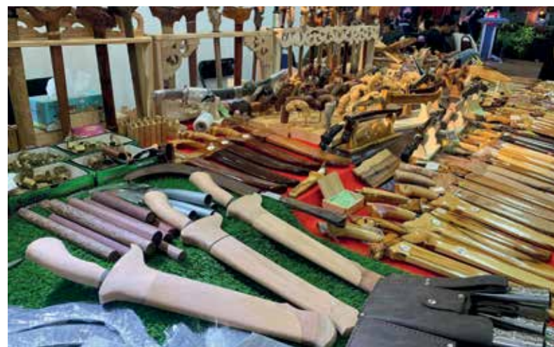
BAHAN-bahan pameran serta jualan seperti capal, kraftangan dan keris yang diadakan sepanjang tempoh berlangsungnya Festival Boria Pulau Pinang.