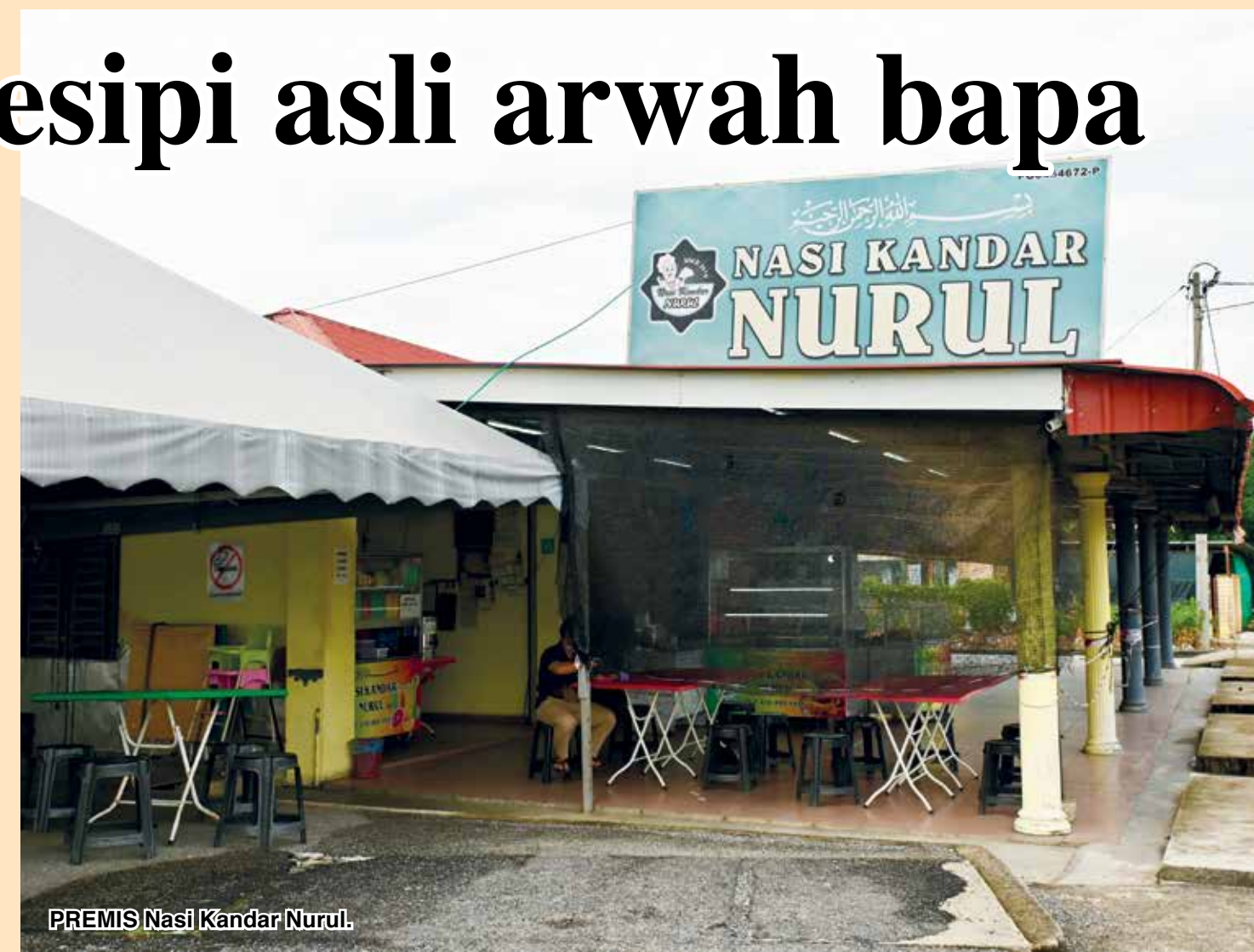
PREMIS Nasi Kandar Nurul.

“Walaupun harga barang naik tetapi kami tidak boleh menaikkan harga makanan atau mengurangkan penggunaan bahan-bahan sesuka hati kerana pelanggan akan ‘lari’.