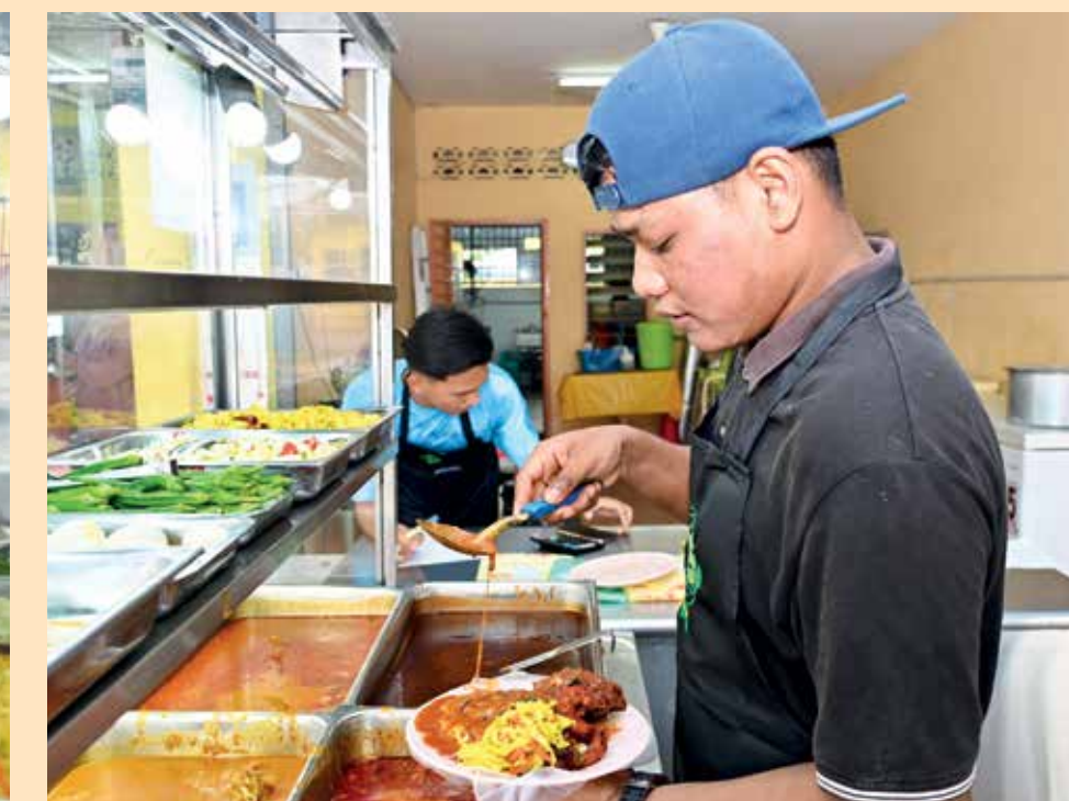
ANAK sulungnya yang menunjukkan minat untuk mewarisi perniagaan tersebut.