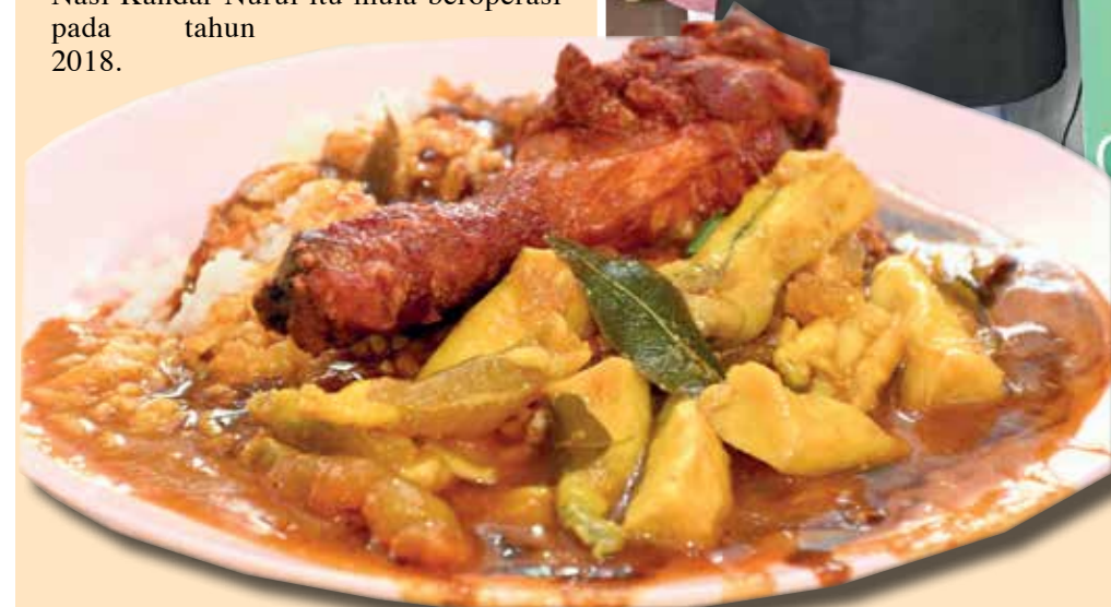
HIDANGAN lengkap yang menjilat jari.

“Ayah saya berhijrah ke Malaysia sejak beliau berumur empat tahun dan membesar serta bersekolah di negara ini.