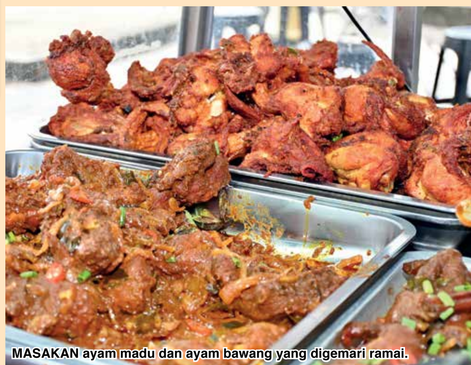
MASAKAN ayam madu dan ayam bawang yang digemari ramai.