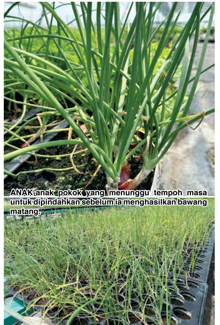
ANAK-anak pokok yang menunggu tempoh masa untuk dipindahkan sebelum ia menghasilkan bawang matang.

“Saya percaya lepas beberapa kali menuai nanti, MARDI akan ada penyelesaian untuk tambah baik beberapa perkara,” katanya menutup bicara.