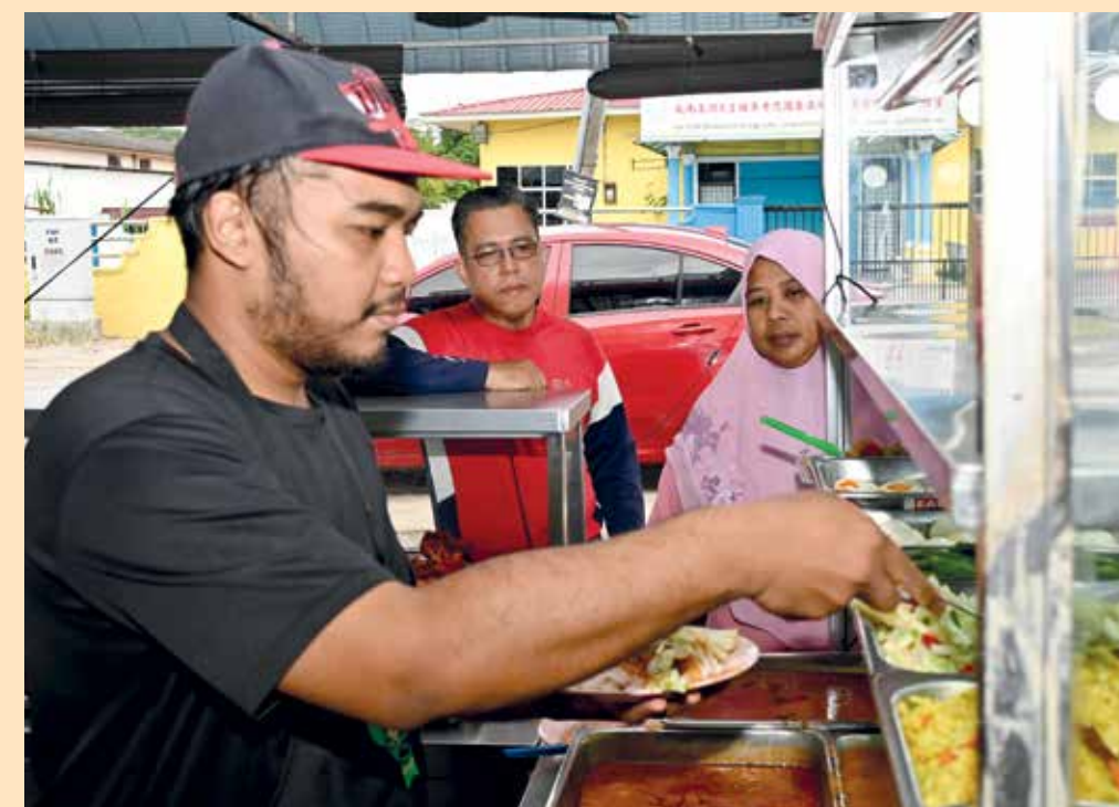
MERAMAHI pelanggan yang datang.

“Tambahan pula, anak sulung saya juga menunjukkan minat untuk mewarisi perniagaan ini, dan saya memang sedang melatih dia mengenai selok-belok perniagaan supaya dia dapat meneruskannya pada masa akan datang,” katanya menutup bicara.