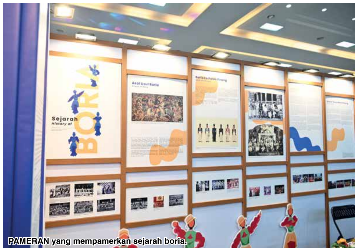
PAMERAN yang mempamerkan sejarah boria.