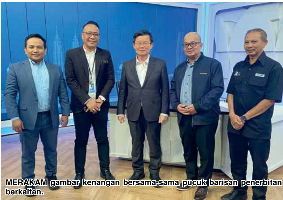
MERAKAM gambar kenangan bersama-sama pucuk barisan penerbitan berkaitan.

Susulan kerancangan sektor industri dan pelancongan, Kon Yeow berkata