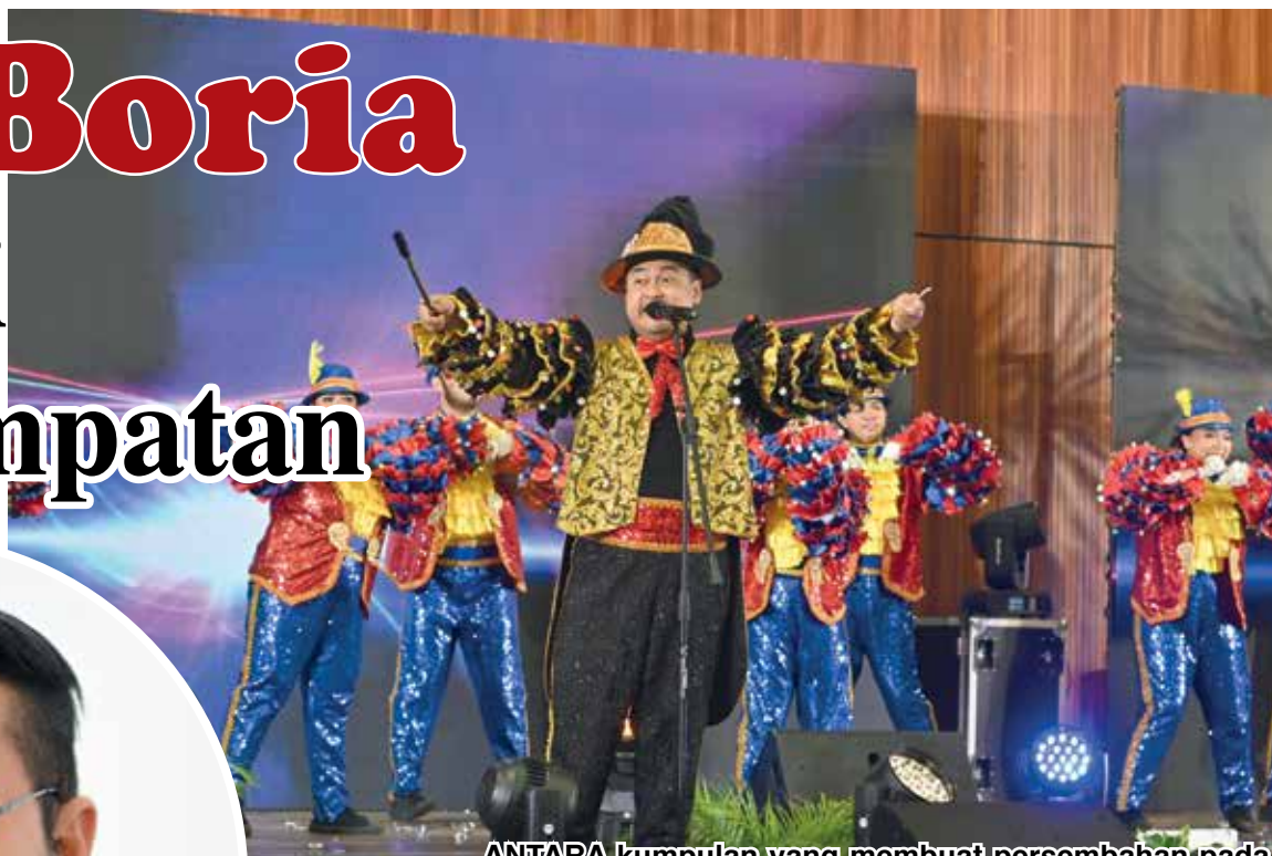
ANTARA kumpulan yang membuat persembahan pada penganjuran pertandingan boria bagi Kategori Terbuka.

“Festival ini juga sudah pasti dapat menggalakkan pertumbuhan ekonomi serta produk yang menyokong