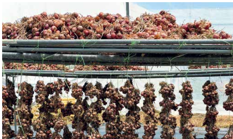
BAWANG yang dituai sedang menjalani proses pengeringan.