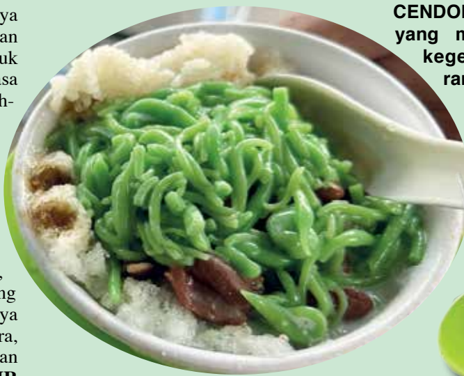
CENDOL Ali yang menjadi kegemaran ramai.

Menurut beliau, setiap hari, Cendol Ali menerima kira-kira 100 orang pelanggan setia.