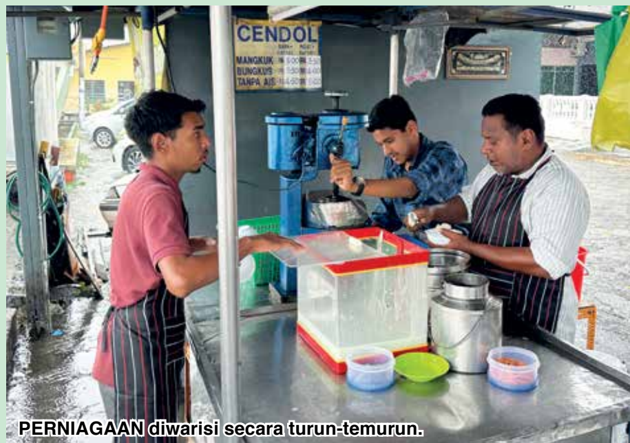
PERNIAGAAN diwarisi secara turun-temurun.