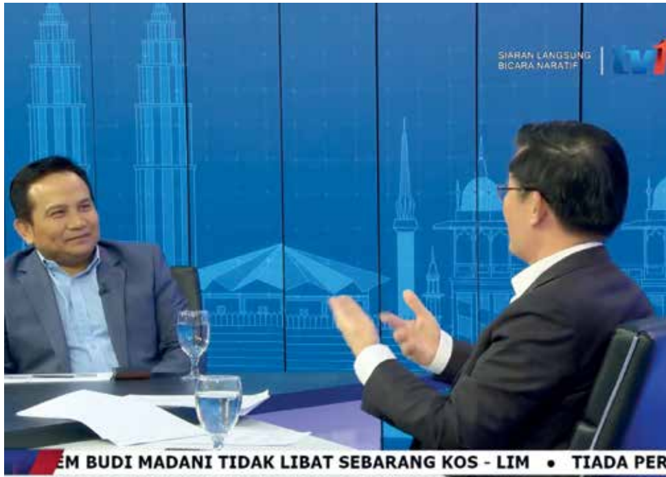
KETUA Menteri ketika diwawancara dalam program bual bicara "Naratif Khas" terbitan RTM di sini baru-baru ini.

"Kalah atau menang PRK Sungai Bakap, projek air perlu diteruskan kerana ia penting bagi kelangsungan masa depan negeri Pulau Pinang sama ada kepada industri atau kehidupan rakyat kebanyakan," katanya dalam program bual bicara "Naratif Khas" terbitan Radio Televisyen Malaysia