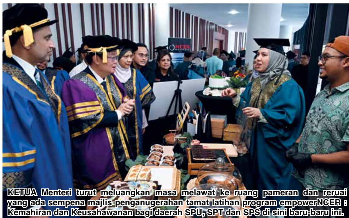
KETUA Menteri turut meluangkan masa melawat ke ruang pameran dan reruai yang ada sempena majlis penganugerahan tamat latihan program empowerNCER: Kemahiran dan Keusahawanan bagi daerah SPU, SPT dan SPS di sini baru-baru ini.

"Justeru, saya mengucapkan setinggi-tinggi penghargaan kepada semua pihak dan agensi yang terlibat secara langsung dan tidak langsung, serta tenaga pengajar yang t i d a k