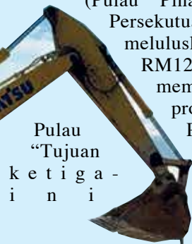
Pulau “Tujuan ketiga- tiga ini