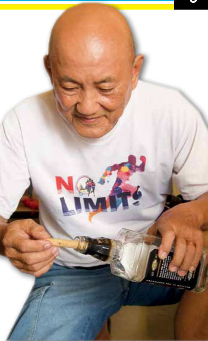
TEKNIK menghasilkan arca dalam botol.