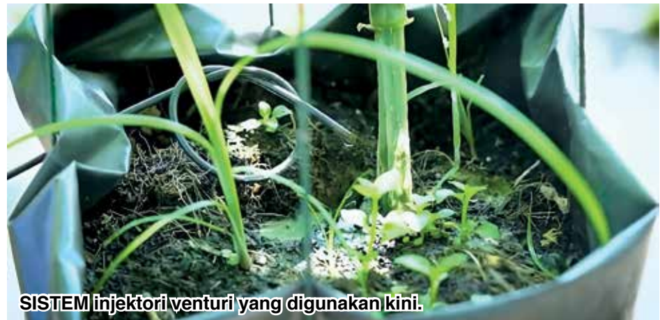
SISTEM injektori venturi yang digunakan kini.

Padang Menora serta mengusahakan tanaman secara konvensional.