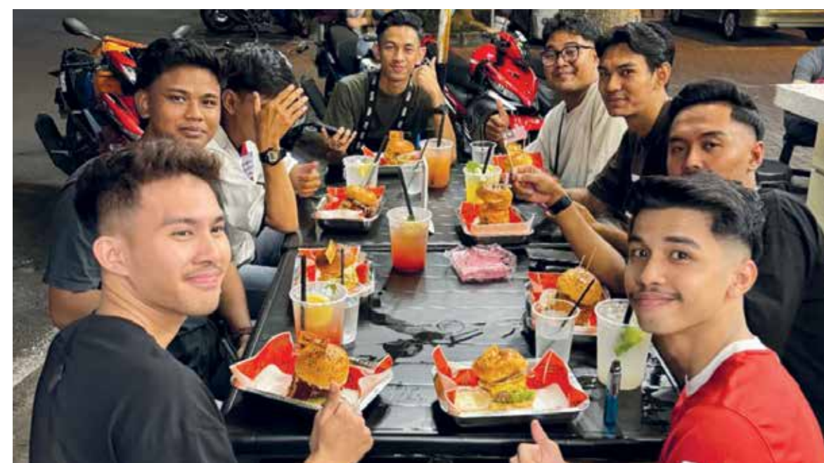
MENU yang terdapat di TheFat.Burger diminati oleh golongan muda.