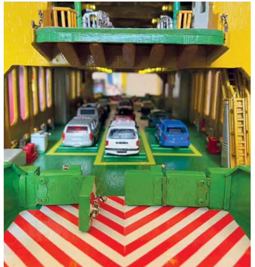
BUTIRAN rekaan yang amat teliti.

“Apabila idea dan ilham datang barulah saya akan sambung semula kerja-kerja