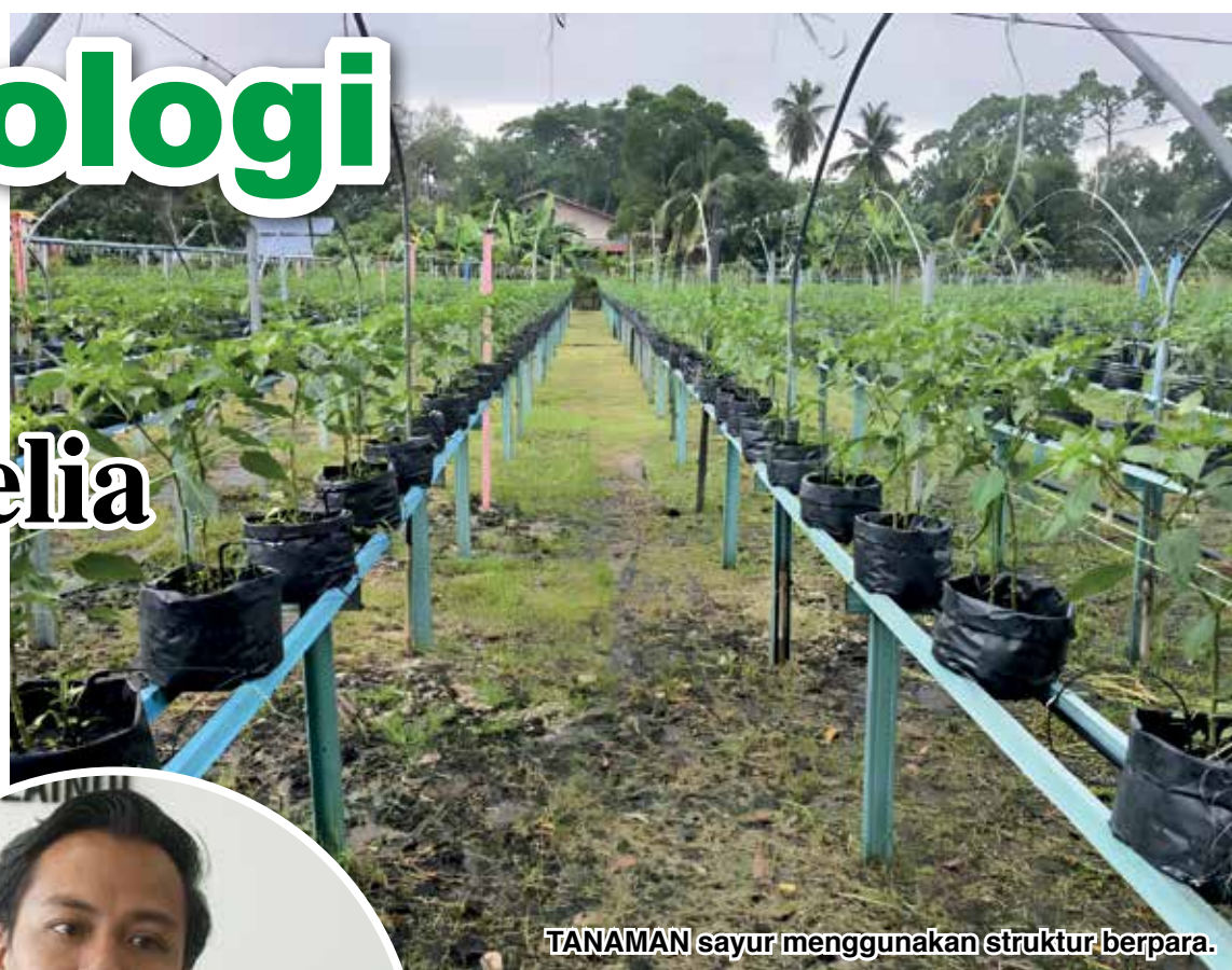
TANAMAN sayur menggunakan struktur berpara.

“Jauh bezanya pertanian tradisional dulu yang menggunakan banyak peralatan seperti cangkul, pemangkas dan sebagainya, tetapi dengan perkembangan teknologi, proses bertani itu menjadi mudah,” katanya ketika dihubungi baru-baru ini.