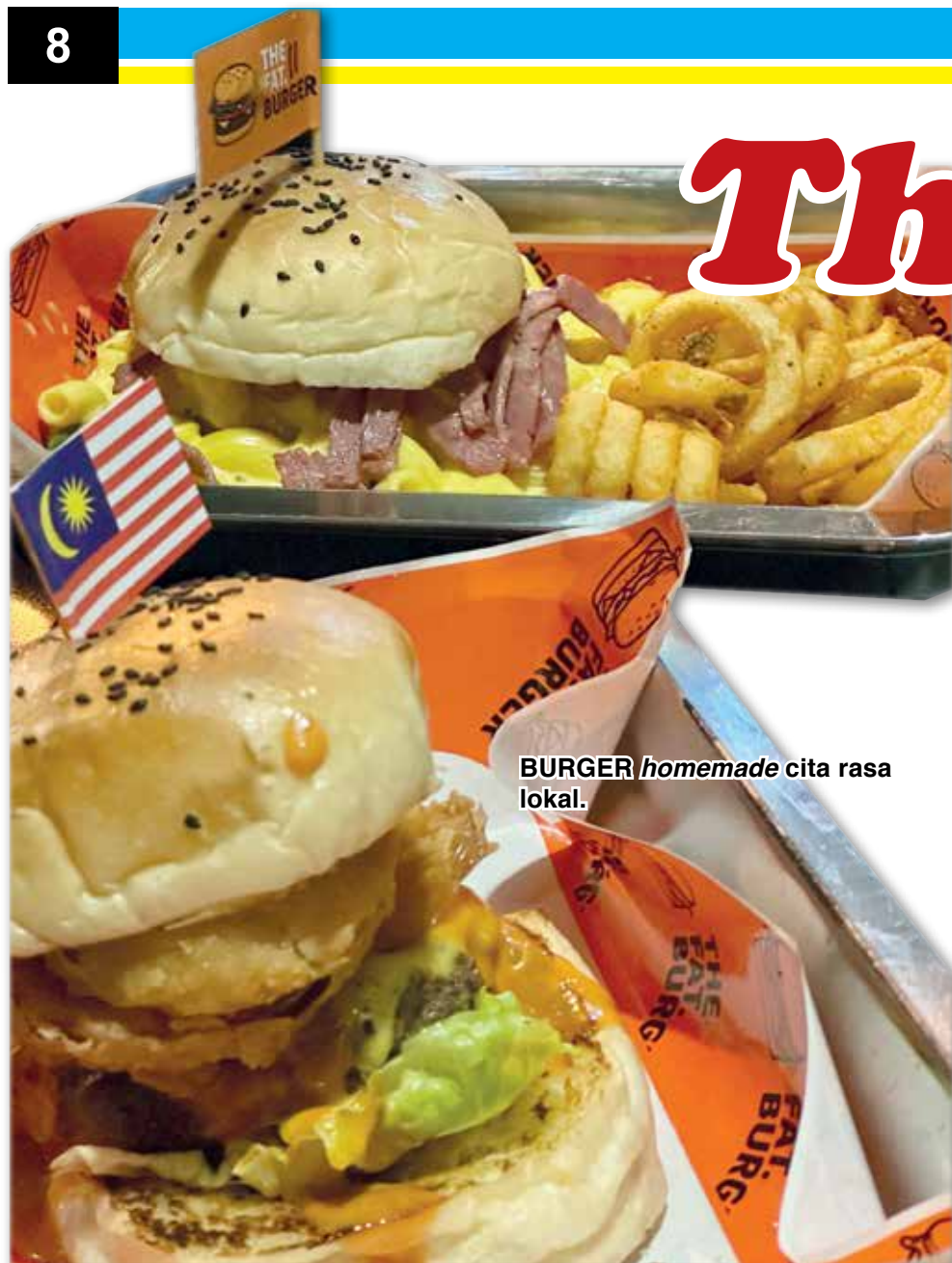
BURGER homemade cita rasa lokal.