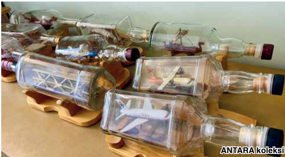
ANTARA koleksi arca dalam botol.