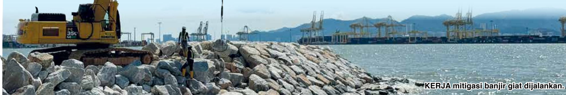
KERJA mitigasi banjir giat dijalankan.