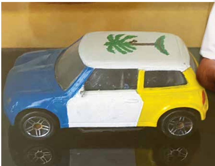
SENTUHAN rekaan kereta mini dengan tema Pulau Pinang.

“Kalau boleh, (bahagian) bawah tempat saya buat kerja, (bahagian) atas pula adalah ruang pameran dan setiap kemasukan dikenakan bayaran berpatutan, itulah impian saya untuk mengembangkan karya seni ini,” katanya mengakhiri bicara.