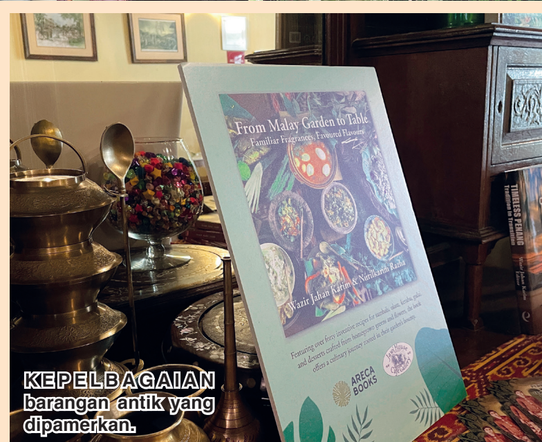
KEPELBAGAIAN barangan antik yang dipamerkan.