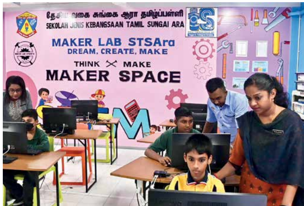
SUASANA Maker Lab di SJKT Sungai Ara.

“Pada karnival ini, SJKT Sungai Ara layak ke pertandingan separuh akhir dalam ‘Robot Battle’ dan ke peringkat akhir dalam ‘Talent Show’.