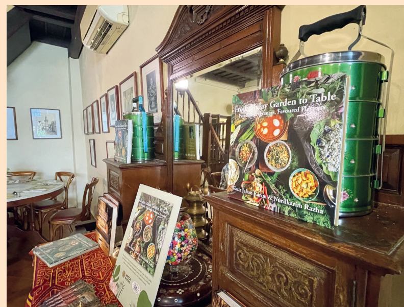
SUSUN atur kafe dengan perabot antik.

"Resipi masakan Jawi House kini menawarkan lebih 60 hidangan istimewa termasuk pencuci mulut... ada juga makanan berasaskan sayur-sayuran sahaja kerana permintaan daripada pelancong antarabangsa.