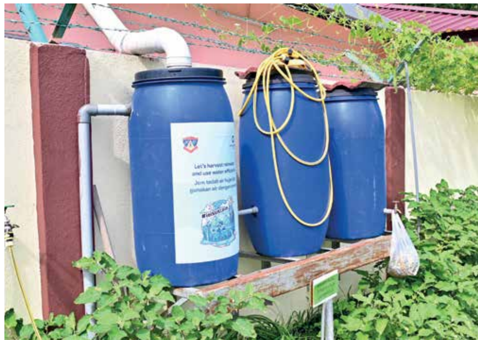
TONG drum yang digunakan untuk menadah air hujan bagi kegunaan berkebun.