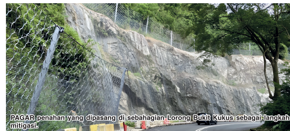
PAGAR penahan yang dipasang di sebahagian Lorong Bukit Kukus sebagai langkah mitigasi.

"Ini adalah demi memastikan pemasangan pagar berfungsi dengan baik sekiranya berlaku runtuh batu serta mengurangkan kesan negatif," katanya.