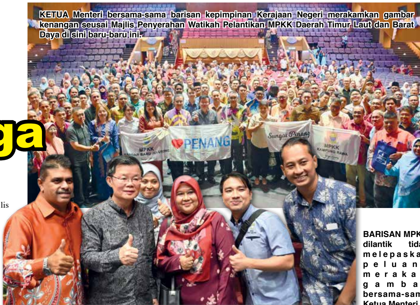
BARISAN MPKK dilantik tidak melepaskan peluang merakamkan gambar bersama-sama Ketua Menteri.

KETUA Menteri bersama-sama barisan kepimpinan Kerajaan Negeri merakamkan gambar kenangan seusai Majlis Penyerahan Watak Pelantikan MPKK Daerah Timur Laut dan Barat Daya di sini baru-baru ini.