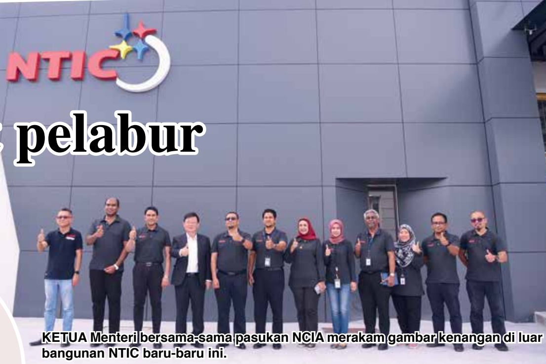
KETUA Menteri bersama-sama pasukan NCIA merakam gambar kenangan di luar bangunan NTIC baru-baru ini.

Bercerita lanjut, Mohamad Haris memberitahu bahawa NTIC yang bakal beroperasi tidak lama lagi akan mengetengahkan beberapa inisiatif utama termasuk Program Meister Teknologi Lanjutan (ATMP), Pembekal Pusat Kecemerlangan (CoEP),