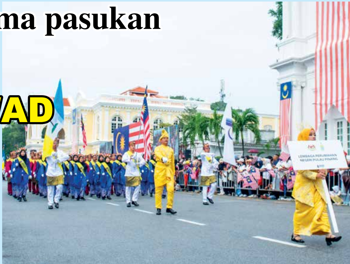
PERGERAKAN kemas dan berdisiplin telah melayakkan kontinjen LPNPP muncul sebagai johan kawad kaki bagi Kategori Sektor Awam sempena Perbarisan dan Perarakan Hari Kebangsaan Ke-67 Peringkat Negeri Pulau Pinang.

Oleh : SUNARTI YUSOFF