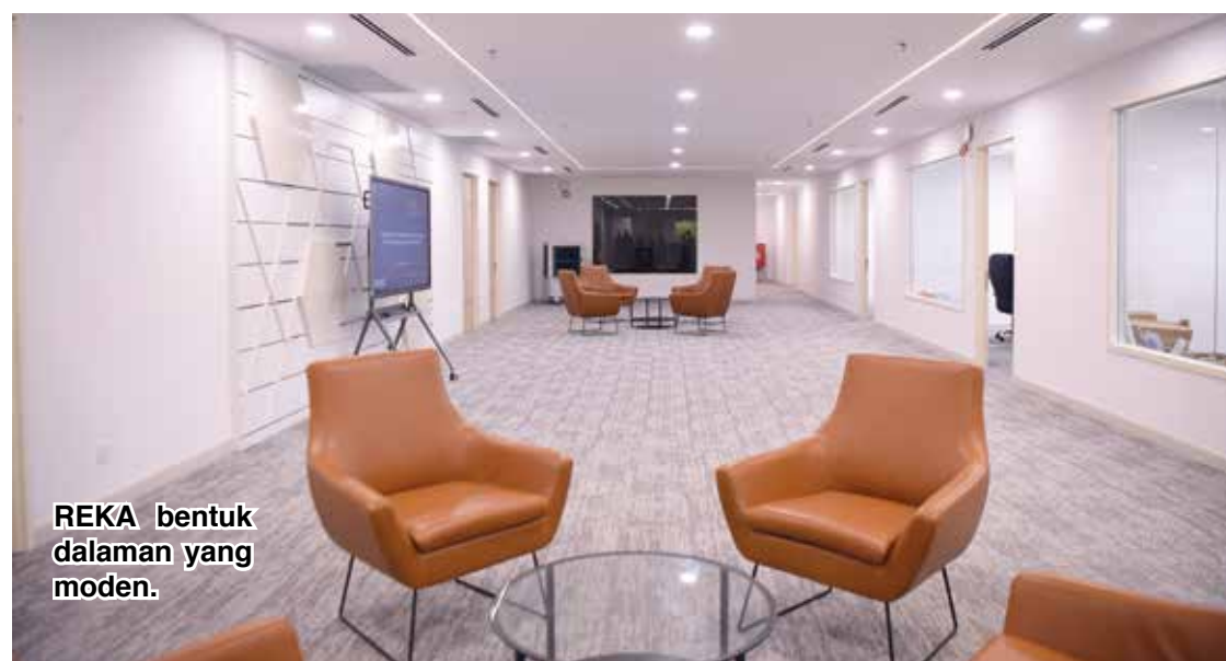
REKA bentuk dalaman yang moden.

“Menerusi kerjasama antara Lembaga Pembangunan Pelaburan Malaysia (MIDA) dan NCIA, negeri (Pulau Pinang) berjaya merealisasikan (aliran masuk) pelaburan (dan) hampir 5,000 peluang pekerjaan (baharu) berjaya diwujudkan enam bulan pertama tahun (2024) ini,” jelasnya sambil menyatakan keyakinan bahawa NTIC akan memperkukuh minat kluster pelabur industri, menyepadu nilai rantaian bekalan serta memupuk budaya inovasi dan teknologi maju.