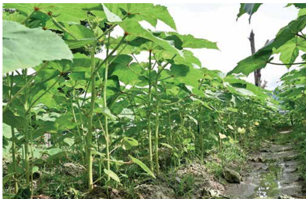
ANTARA tanaman yang ditanam oleh guru dan pelajar di kawasan sekolah.

“Aktiviti berkebun turut diadakan yang mana sekolah ini mempunyai pokok pisang dan pokok bunga yang ditanam sendiri oleh para pelajar dan guru di sekolah ini,” jelasnya yang meletakkan harapan agar amalan baik yang dilaksanakan kini dapat diterapkan dan menjadi ikutan pada masa hadapan.