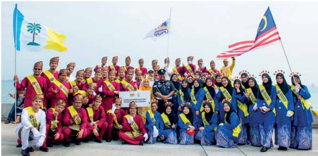
KONTINJEN LPNPP bergambar kenang-kenangan sebelum memulakan acara perbarisan.

“Ini merupakan sebahagian daripada langkah LPNPP