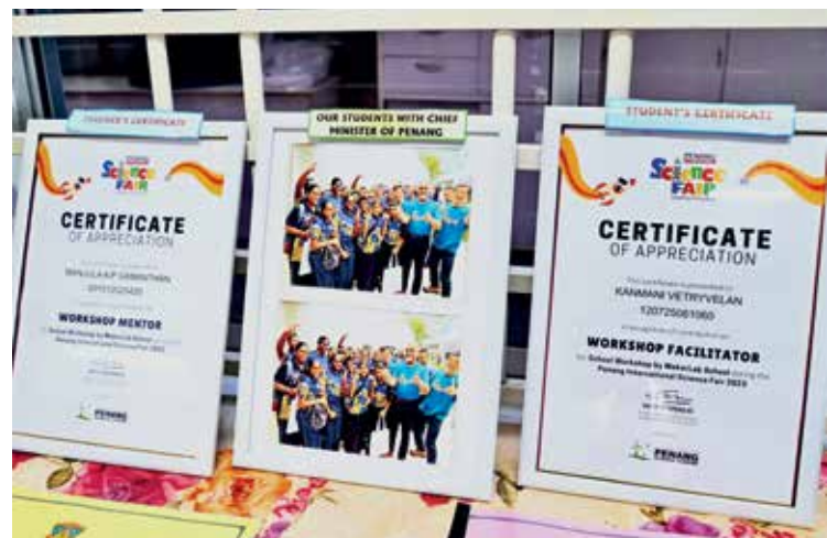
ANTARA pengiktirafan yang diterima hasil penglibatan dalam aktiviti berasaskan STEM baru-baru ini.

"Selain itu, dengan adanya MakerLab ini, para pelajar juga lebih bersemangat untuk menghadiri kelas robotik, dron serta pengekodan Scratch walaupun diadakan selepas waktu persekolahan