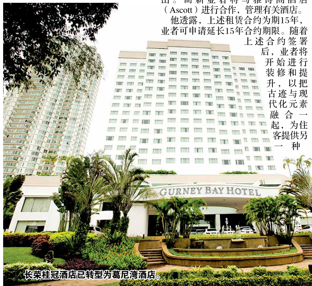
长荣桂冠酒店已转型为葛尼湾酒店。

他是在日前见证槟城1926古迹酒店新业者Jetblue有限公司与槟州发展机构进行签约仪式时，如是指出。