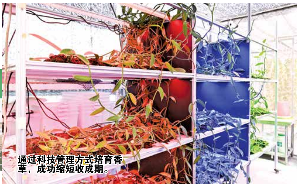
通过科技管理方式培育香草，成功缩短收成期。