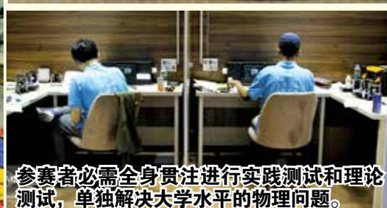
参赛者必需全身贯注进行实践测试和理论测试，单独解决大学水平的物理问题。