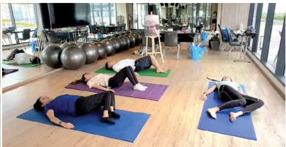
▲借用酒店舒服优美和放松的环境，让学员们学习自我疗愈。