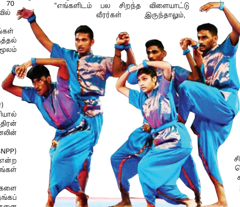
ஆயுதம் இல்லாத தாள படைப்பில் பிணங்கு போட்டியாளர்கள் சிறந்த படைப்பினை வழங்கினார்.

“எங்களிடம் பல சிறந்த விளையாட்டு வீரர்கள் இருந்தாலும்,