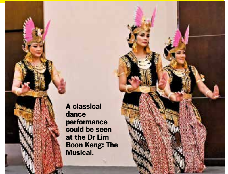
A classical dance performance could be seen at the Dr Lim Boon Keng: The Musical.

The musical screening, organised by the Commonwealth of World Chinatowns (CWC), highlighted Boon Keng's life and his substantial contributions to