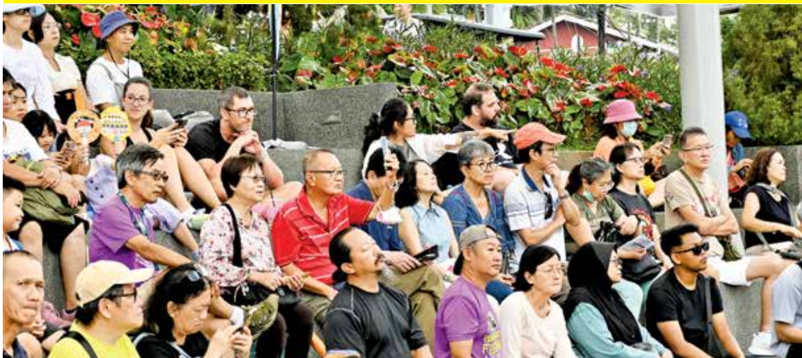
A large group of visitors from various backgrounds thronged the special concert at Penang Hill.