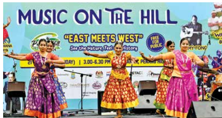
A captivating performance by BhaavaNarthana Natyalaya.

“Today, we witness the best of our local talents through one of the Penang Hill Festival’s best highlights, ‘Music on the