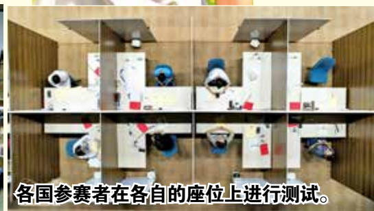
各国参赛者在各自的座位上进行测试。