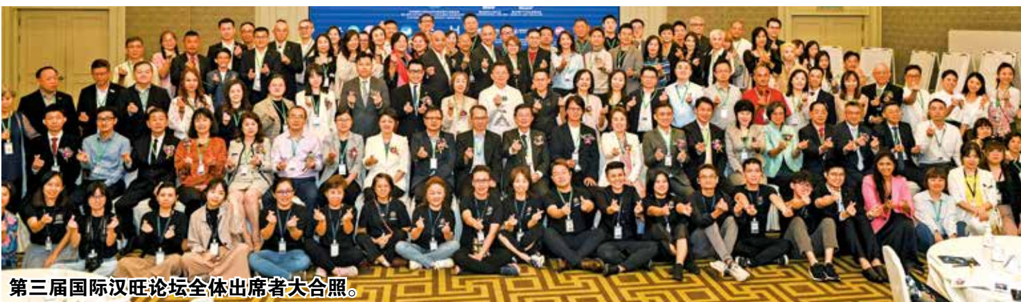
第三届国际汉旺论坛全体出席者大合照。

系。科技创新为文化遗产提供了新的载体和应用形式，使文化能够在新的语境中得到传播和延续。