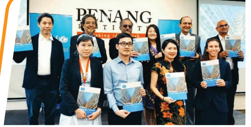
'Families On Edge' திட்டத்தை இரண்டாம் துணை முதலமைச்சர் ஜகதீப் சிங் டியோ, ஆட்சிக்குழு உறுப்பினர் லிம் சியூ கிம் மற்றும் முக்கிய பிரதிநிதிகள் அறிமுகம் செய்தனர்.