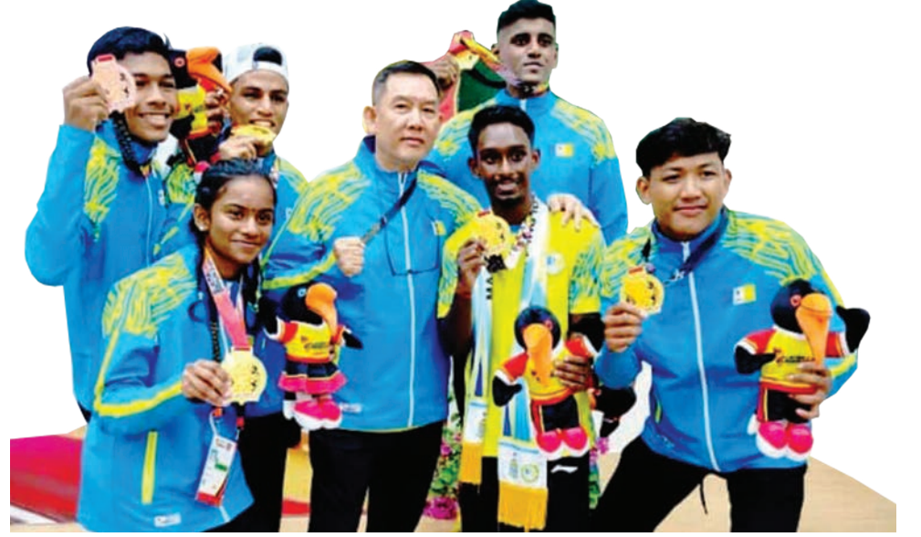
சுக்மா போட்டியில் வெற்றி பெற்ற பினாங்கு குத்துச் சண்டை அணியுடன் பினாங்கு விளையாட்டு மன்ற பிரதிநிதிகள் குழுப்படம் எடுத்துக் கொண்டனர்.

உண்மையில் எங்கள் குத்துச்சண்டை விளையாட்டு வீரர்கள் சுக்மாவில் மொத்தம் ஐந்து தங்கப் பதக்கங்களை சேகரிக்கும் அளவிற்கு சிறப்பாக செயல்பட உதவியது.