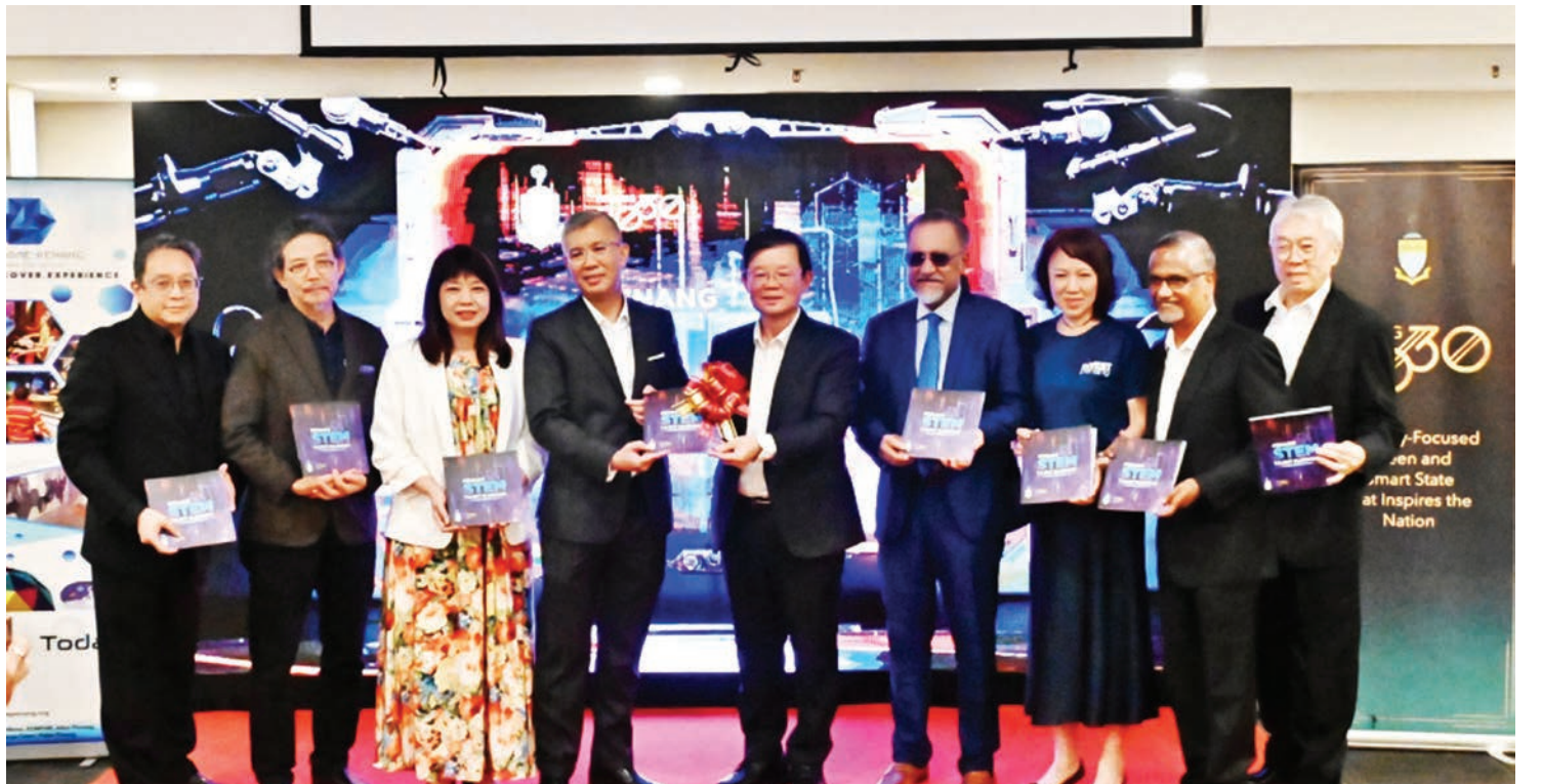
பினாங்கு ஸ்தெம் திறமை வியூகத் திட்டத்தை பினாங்கு முதலமைச்சர் சாவ் கொன் இயோவ் உடன் முதலீடு, வர்த்தகம் மற்றும் தொழில்துறை அமைச்சர் தெங்கு டத்தோனூ ஜஃப்ருல் அப்துல் அஜீஸ் ஆகியோர் அறிமுகப்படுத்தினர்.

இடைநிலைப்பள்ளிகளில் ஸ்தெம் மாணவர் சேர்க்கையின் எண்ணிக்கையை இரட்டிப்பாக்குவது, பல்கலைக்கழகங்களில் ஸ்தெம் பட்டதாரிகளை அதிகரிப்பது, ஸ்தெம் தொடர்பான தொழில்நுட்பம், தொழிற்கல்வி மற்றும் பயிற்சி (TVET) வெளியீட்டை அதிகரிப்பது மற்றும் ஸ்தெம் துறைகளில் பெண்கள் பங்கேற்பை