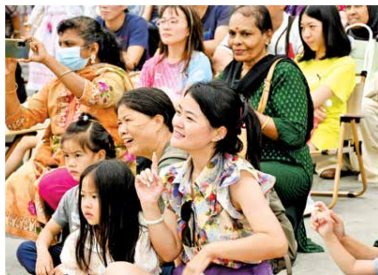
Visitors enjoying the performances.

Chin Woo was founded by the famous Chinese martial artist, Huo Yuanjia, in Shanghai in 1910. Today, it has spread worldwide, with 77 Chin Woo organisations.