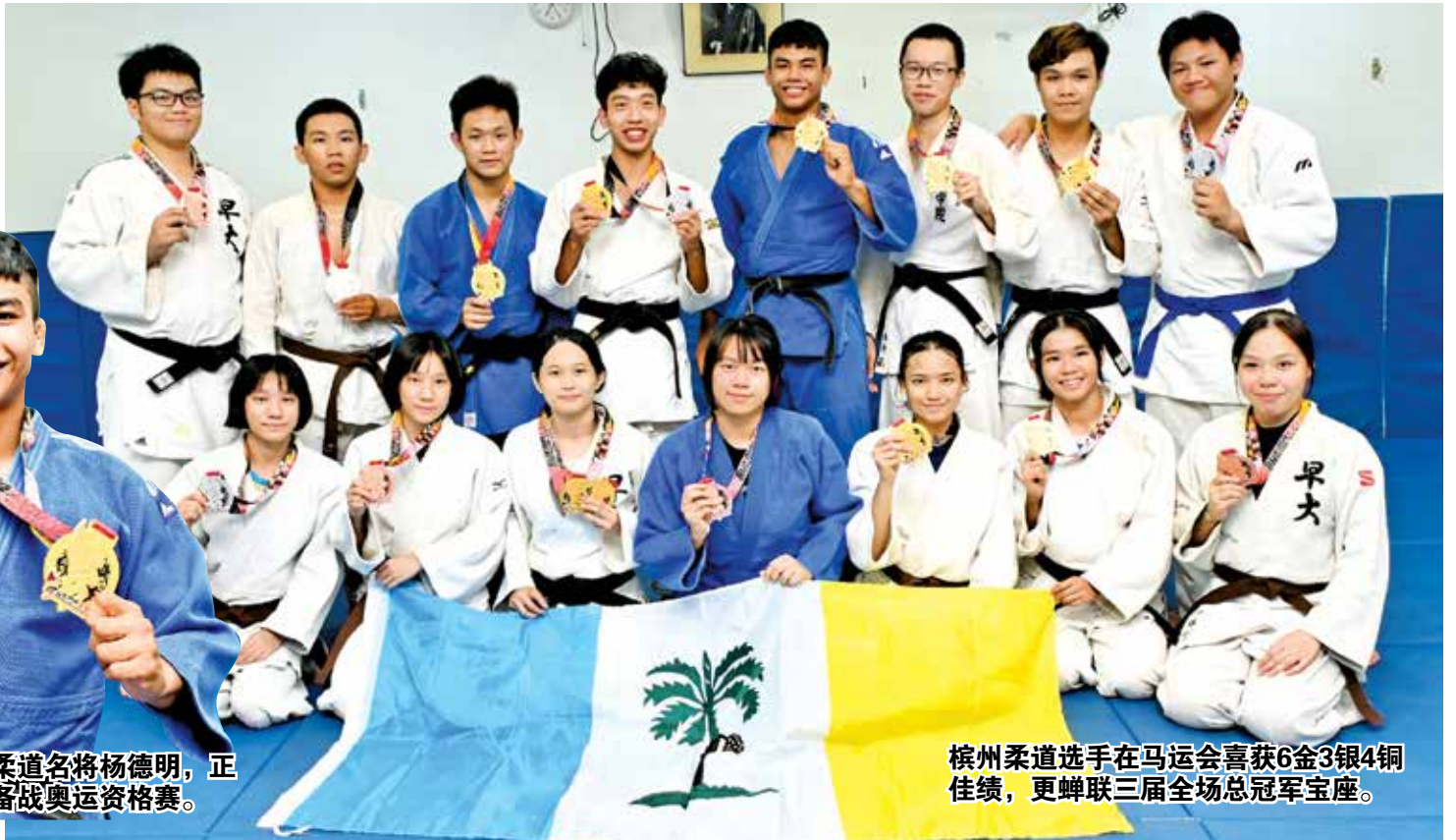
槟州柔道选手在马运会喜获6金3银4铜佳绩，更蝉联三届全场总冠军宝座。

不过，两人的羁绊深厚，三年来为了马运会金牌，每天都在一起训练，在比赛时的互相鼓励，成了她们缓解比赛压力，取得好成绩的“秘密武器”。