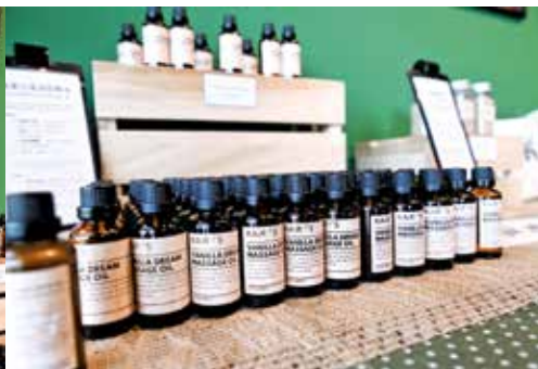
香草按摩油让人闻之放松。