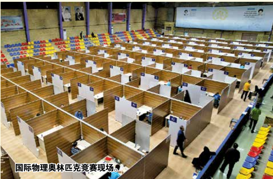
国际物理奥林匹克竞赛现场。