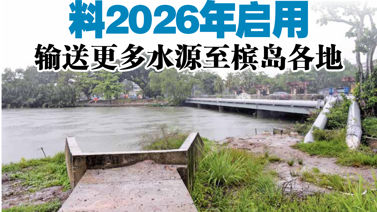
北赖河跨河管道项目料2026年启用，输送更多水源至槟岛各地。

槟州供水机构已启动耗资1700万令吉的北赖河跨河管道项目，预计耗时8至18个月左右完成。