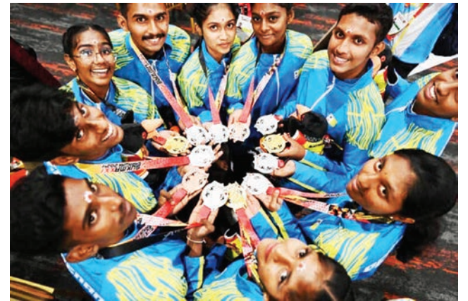
சுக்மா சிலம்பம் போட்டியில் பிணங்கு அணியினர் மூன்று தங்கம், மூன்று வெள்ளி வென்று சாதனைப் படைத்தனர்.

சுக்மாவுக்கு தகுதி பெற அவர்களுக்கு பயிற்சி அளிக்க குறைந்தது இரண்டு ஆண்டுகள் ஆகும்,” என்று அவர் கூறினார்.