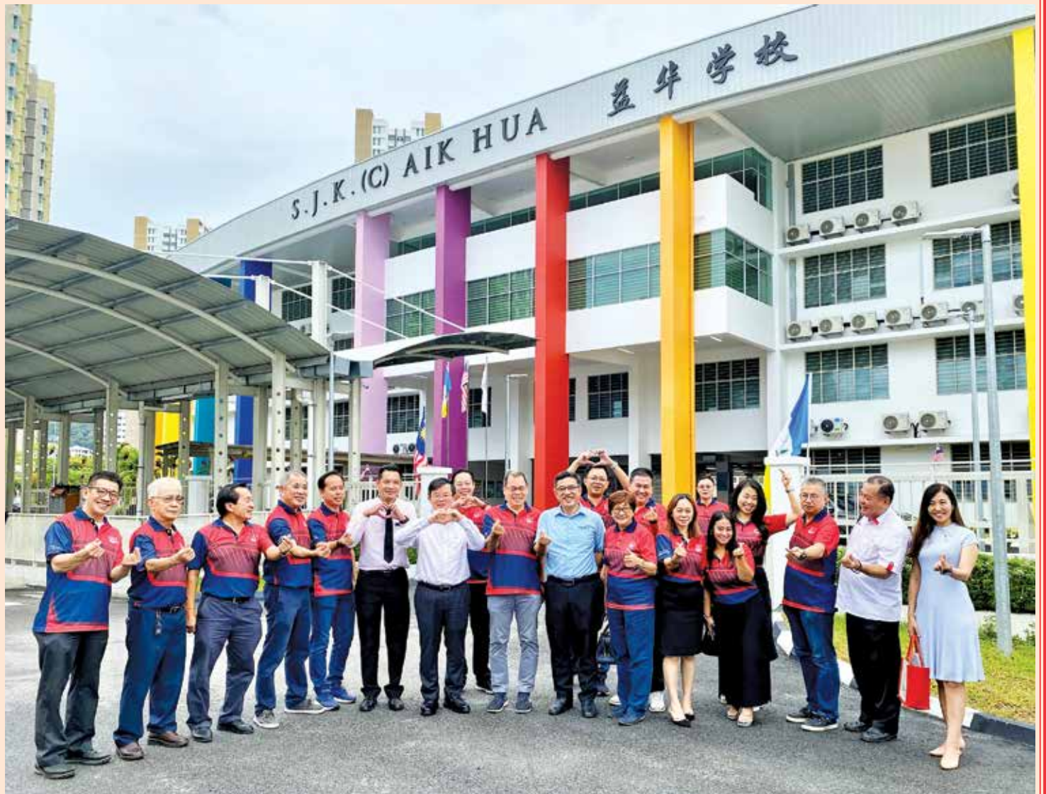
槟州首长曹观友欣见新港新校舍落成，见证该校迈向新里程碑。