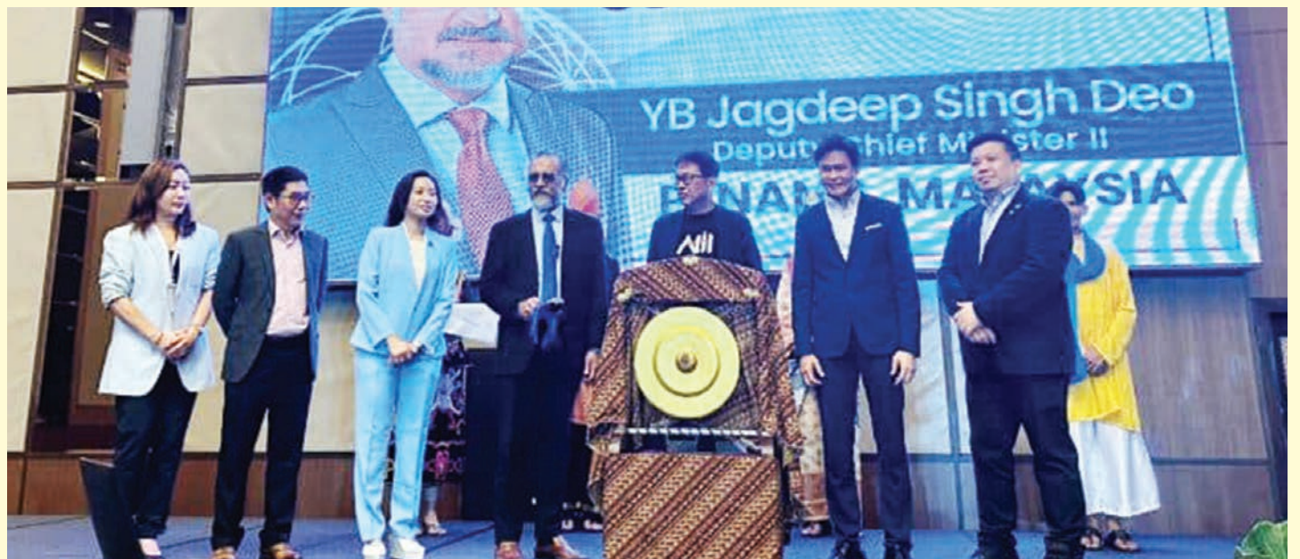
பிளாங்கு மாநில இரண்டாம் துணை முதலமைச்சர் ஜக்தீப் சிங் டியோ ஆசியாவின் மேம்பட்ட கண்டுபிடிப்பு மற்றும் உற்பத்தி வாரம் (AIM) 2024-ஐ தொடங்கி வைத்தார்.

பங்கேற்பாளர்களில் AI தொழில்நுட்பம், நிலைத்தன்மை மற்றும் மூலதனம் திரட்டும் உத்திகள் ஆகியவற்றில் நிபுணத்துவம் வாய்ந்த வல்லுநர்கள் மற்றும் தொழில்நுட்ப முனைவோரும் அடங்குவர்.