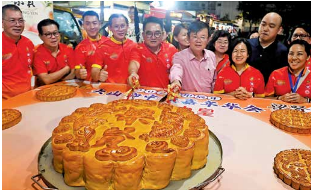
“大山脚中秋嘉年华”中的巨型月饼，成为活动的亮点之一！

就是提倡团圆与和谐，所以我希望这项文化元素可以融入马来西亚中，打造更多元包容的社会。”