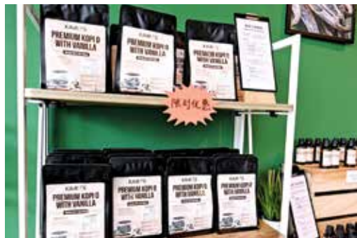
要尝尝香草咖啡吗？