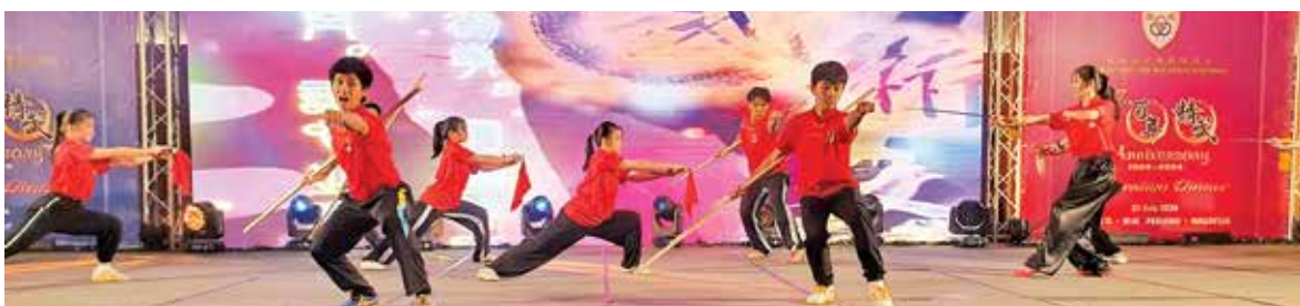
Chin Woo members demonstrating their martial arts skills at the dinner celebration.

The groups included BhaavaNarthana Natyalaya, Penang Youth Orchestra, Culture Shot,