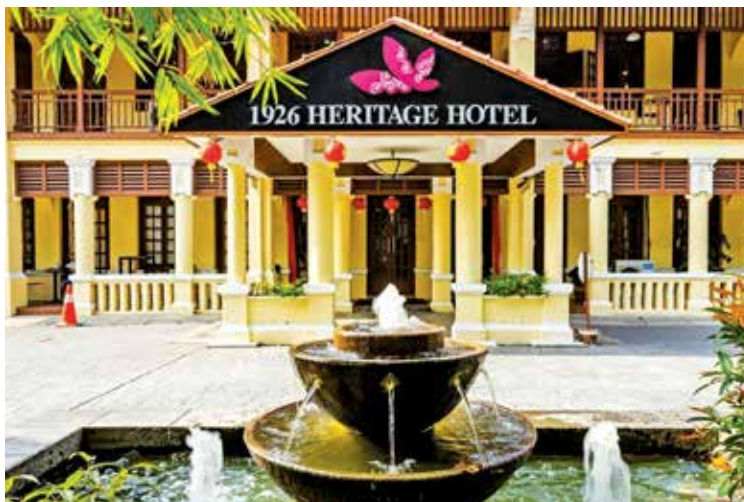
空置逾4年的车水路槟城1926古迹酒店，预计在2026年重新营业。