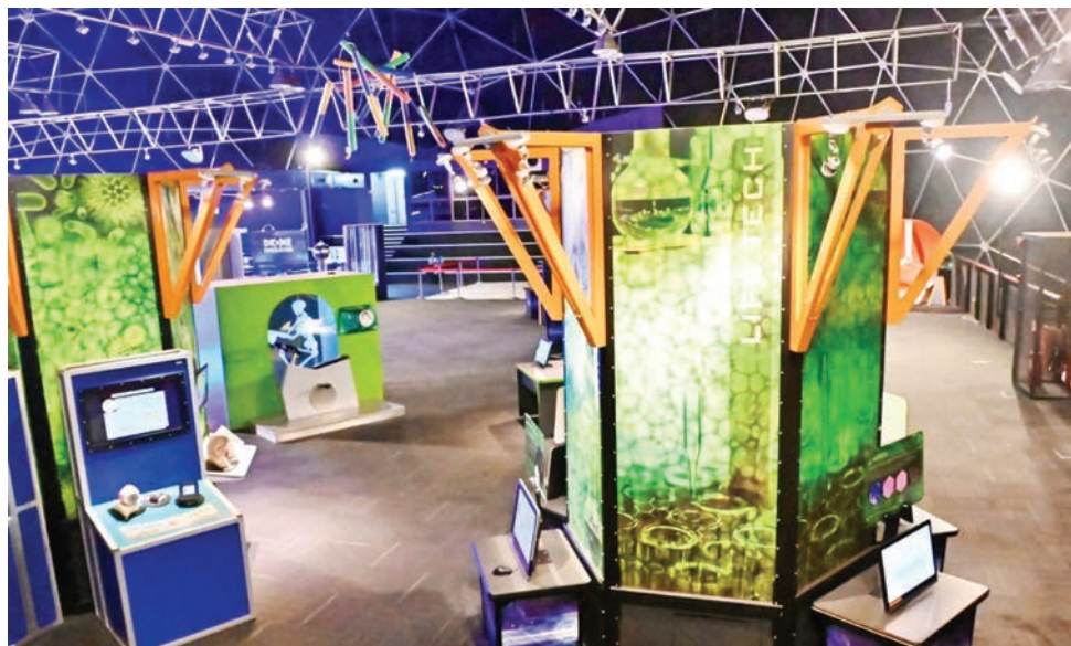
பினாங்கு தெக் டோமில் உள்ள அறிவியல் மற்றும் தொழில்நுட்ப படைப்புகளைப் படத்தில் காணலாம்.

கணிசமாக உயர்த்துவது ஆகியவற்றை நோக்கமாகக் கொண்ட வியூகத் திட்டம் '2X உத்தியையும் சாவ் குறிப்பிட்டார்.