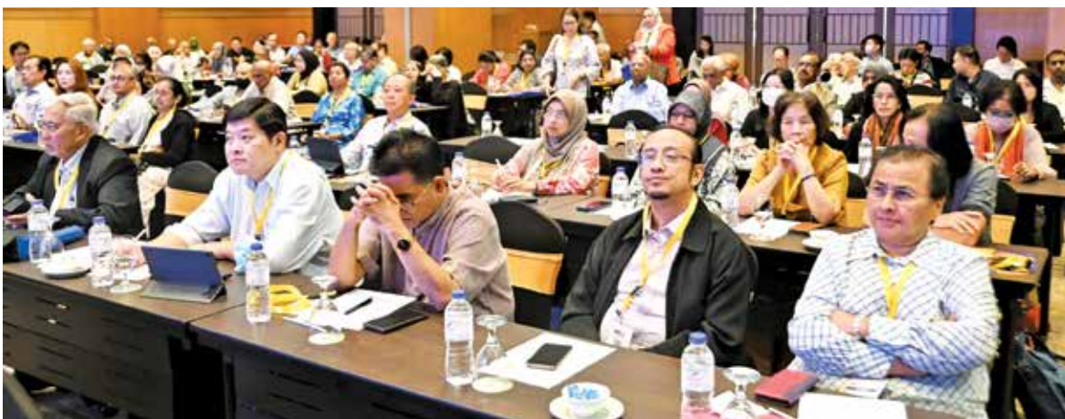
Some of the participants who took the opportunity to update and enhance their knowledge and skills.