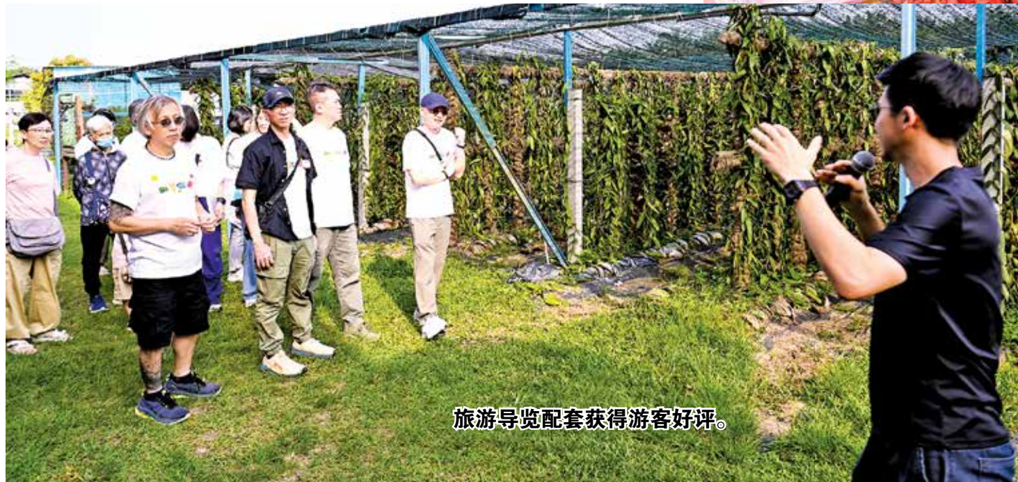
旅游导览配套获得游客好评。