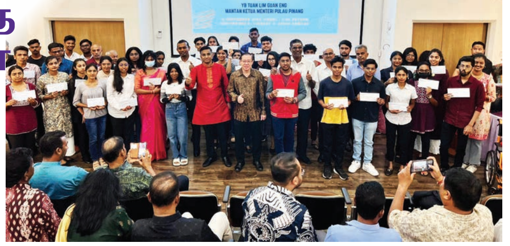
2023-ஆம் ஆண்டு எஸ்.டி.பி.எம் தேர்வில் சிறந்த தேர்ச்சிப் பெற்ற மாணவர்களுக்கு ஊக்கத்தொகை வழங்கிய பின்னர் பாகான் நாடாளுமன்ற உறுப்பினர் லிம் குவான் எங் மற்றும் பிளாங்கு இந்து அறப்பணி வாரிய ஆணையர்கள் குழுப்படம் எடுத்துக் கொண்டனர்.

“இது மாணவர்களுக்குக் கிடைத்த வெற்றியின் முதல் படிகளாகும். பிளாங்கு2030 இலக்கை நோக்கிப் பயணிக்கும் பொருட்டு மாணவர்கள் கிடைக்கப்பெறும்