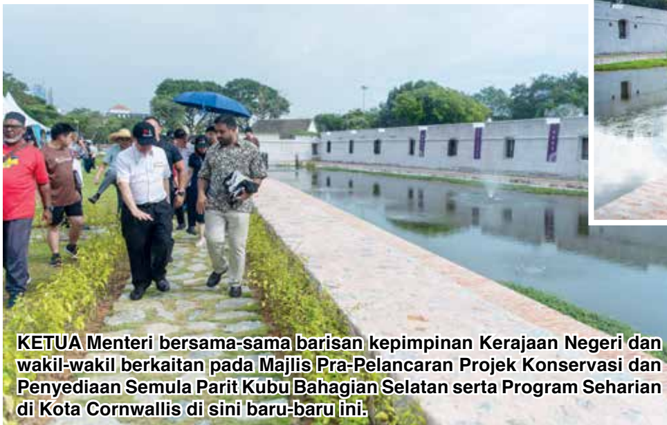
KETUA Menteri bersama-sama barisan kepimpinan Kerajaan Negeri dan wakil-wakil berkaitan pada Majlis Pra-Pelancaran Projek Konservasi dan Penyediaan Semula Parit Kubu Bahagian Selatan serta Program Sehariannya di Kota Cornwallis di sini baru-baru ini.

“Kerja-kerja pemuliharaan semula parit kubu di bahagian selatan dan barat dijadual selesai Julai tahun depan (2025) yang mana kita pun bercadang untuk buka kepada orang awam,” jelasnya seusai