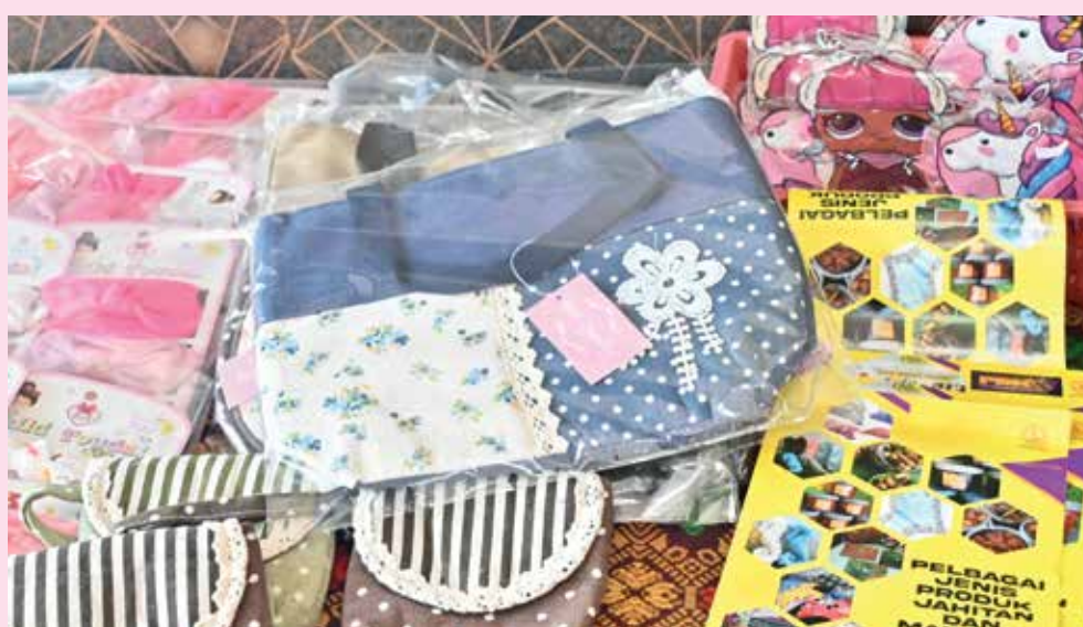
PRODUK-produk yang dihasilkan pelatih.

"Menariknya di sini, ada pelatih yang sudah mencecah usia 41 tahun, dan ada juga yang telah melengkapkan latihan di sini dan (kami) petugas yakin