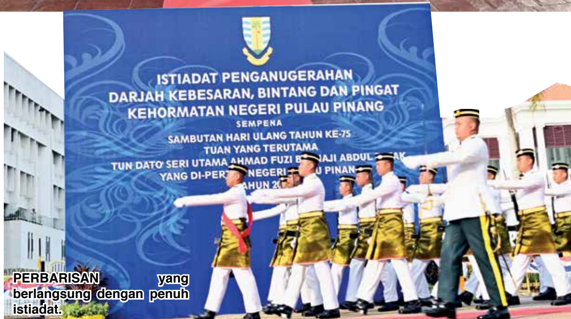
PERBARISAN yang berlangsung dengan penuh istiadat.