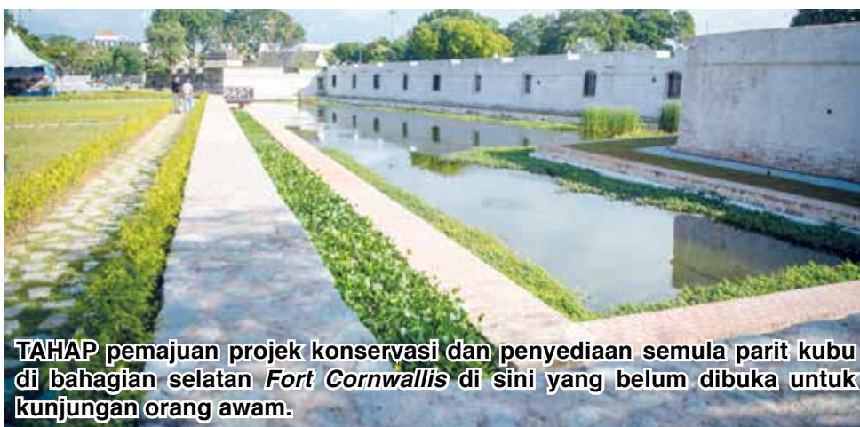
TAHAP pemajuan projek konservasi dan penyediaan semula parit kubu di bahagian selatan Fort Cornwallis di sini yang belum dibuka untuk kunjungan orang awam.