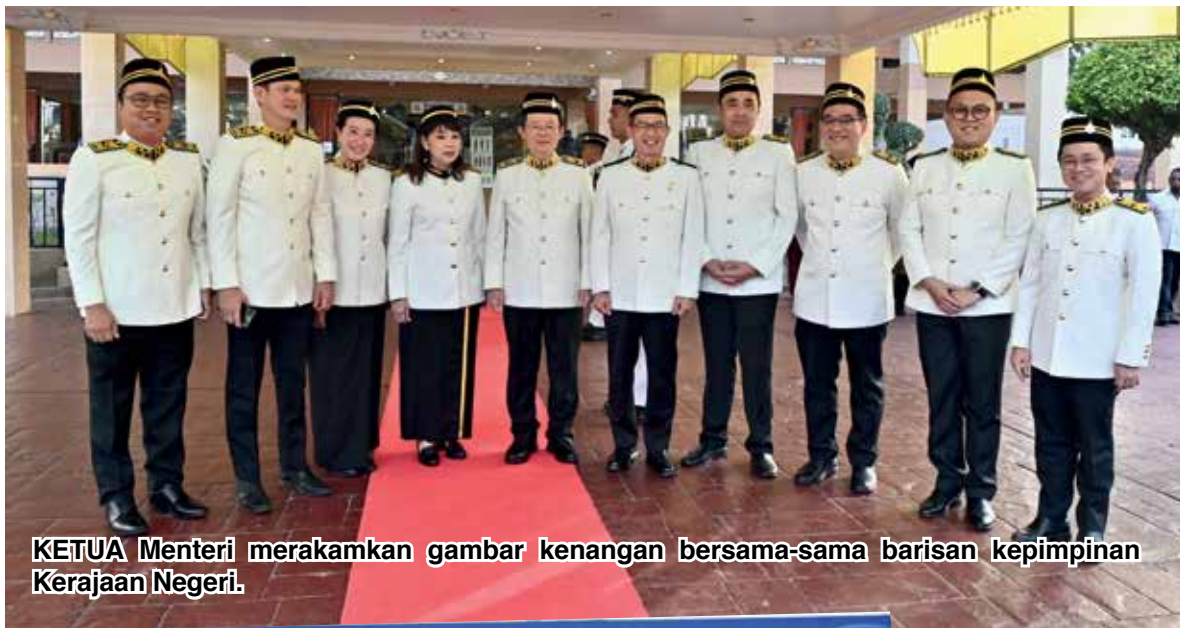
KETUA Menteri merakamkan gambar kenangan bersama-sama barisan kepimpinan Kerajaan Negeri.