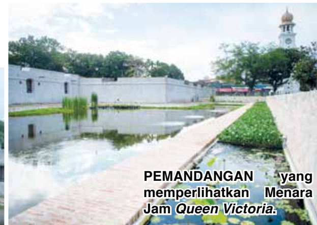
PEMANDANGAN yang memperlihatkan Menara Jam Queen Victoria .

Majlis Pra-Pelancaran Projek Konservasi dan Penyediaan Semula Parit Kubu Bahagian Selatan serta Program Sehariannya di Kota Cornwallis dekat sini pada 7 Julai 2024.