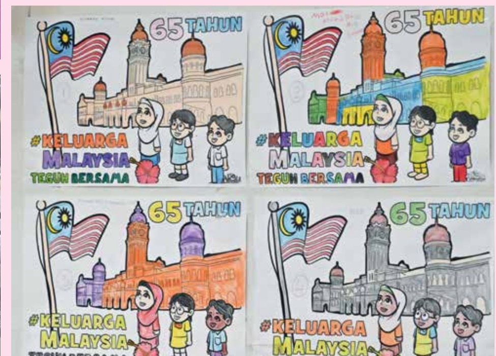
LUKISAN-LUKISAN kreatif yang dihasilkan.

"Justeru, pihak pusat jagaan turut menerima bantuan dari segi keperluan barangan dan sebagainya kepada pelatih di sini," ulasnya apabila diajukan soalan berhubung cabaran petugas di pusat jagaan tersebut.