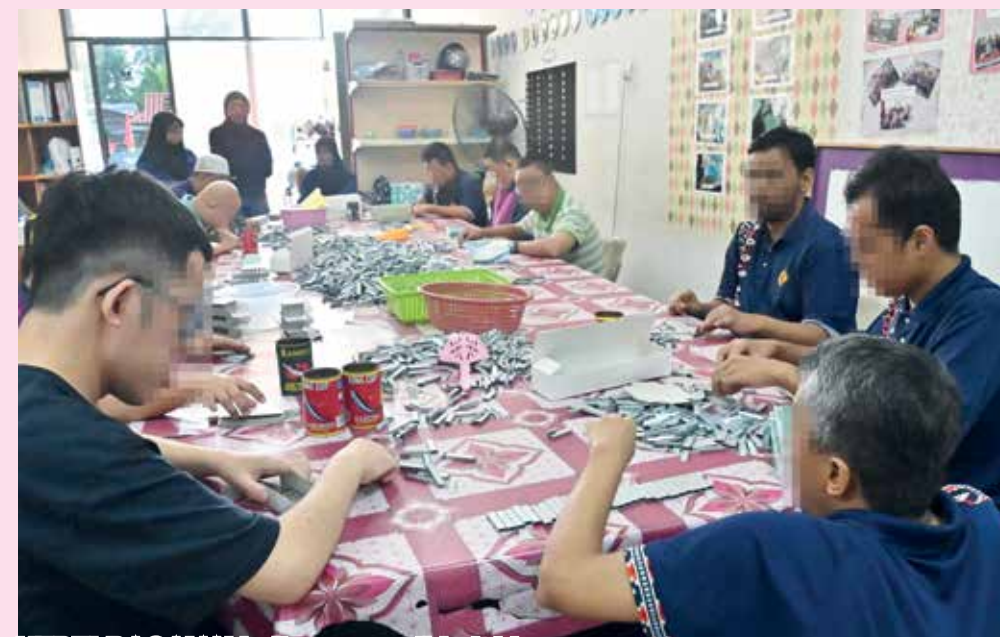
KEPELBAGAIAN latihan yang didedahkan.