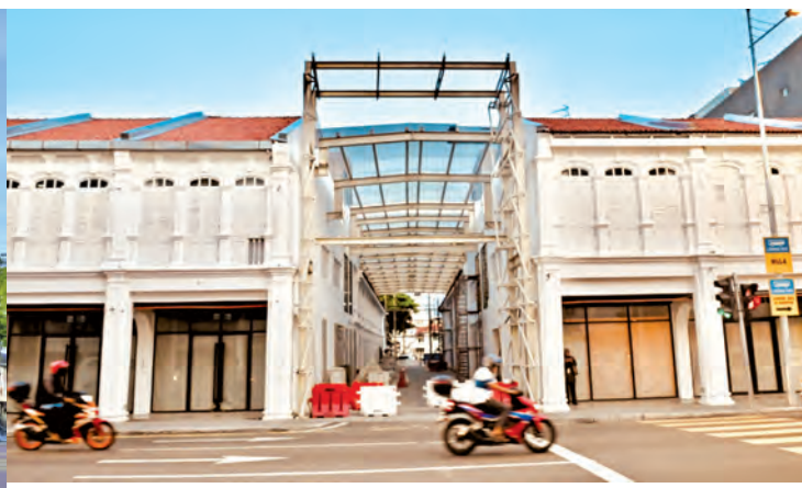
槟榔律光大对面一家附有盖顶的特色酒店，紧锣密鼓装修中，预料不久后投入营业。