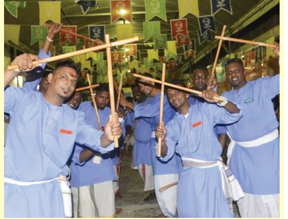
வாட்டர்ஃபோல் கோலாட்டக் குழுவினர் தங்கள் ஆட்டத் திறமையை வெளிப்படுத்தினர்.