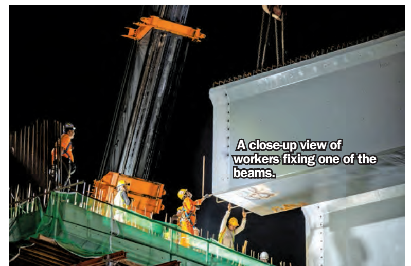
A close-up view of workers fixing one of the beams.

"While we are ahead of schedule, I urge contractors to ensure