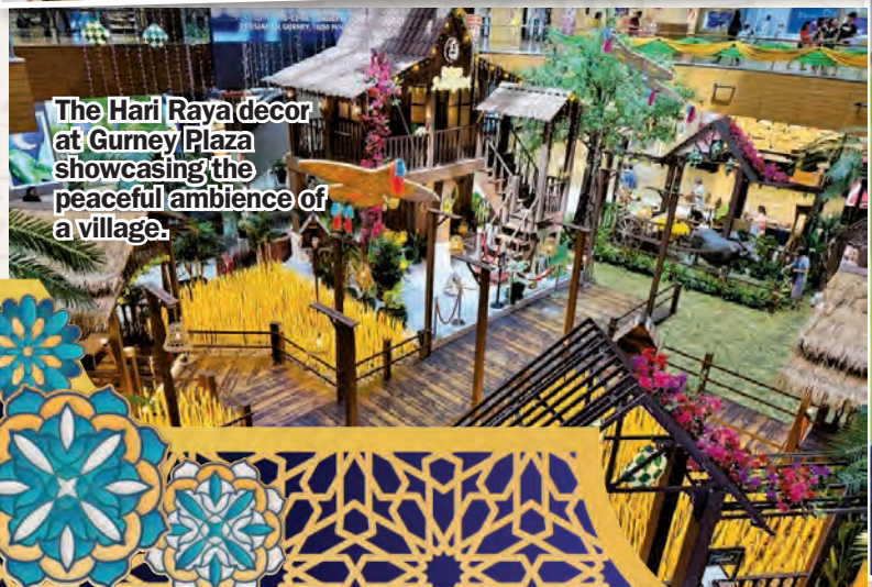
The Hari Raya decor at Gurney Plaza showcasing the peaceful ambience of a village.