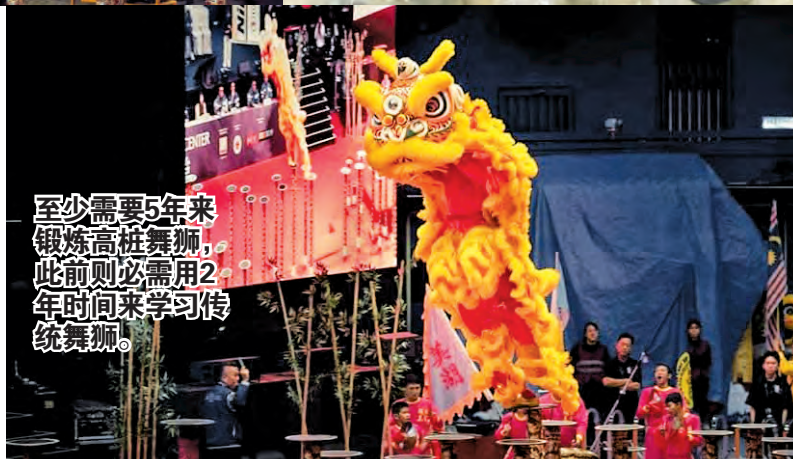
至少需要5年来锻炼高桩舞狮，此前则必需用2年时间来学习传统舞狮。

“因为地缘关系，我这里的团员多为美湖当地人，毕竟这里和市区有一段距离，不是每个人都有毅力常年报到修习狮艺，如果不是当地人我都会劝他们三思。”