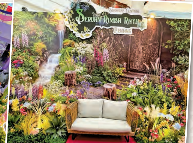
The 'Seruan Rimba Raya' Penang decorations mesmerise shoppers at Sunshine Central.