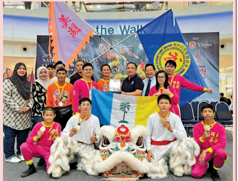
狮团过去获奖无数，更曾在2015年 新光大全槟传统南狮争霸赛中，包办冠、亚、季军。

成训练后，回到家里还需完成手头工作和家里的事情。虽然很累，但看着团员们凝聚在一起为了狮团努力和进步，对他而言却很充实和很有满足感。