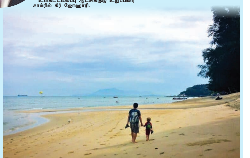
பத்து ஃபிரிங்கி கடற்கரை சூழலை படத்தில் காணலாம்.

பிளாங்கின் வடக்கு கடற்கரையோரத்தில் இணைப்பை மேம்படுத்துவதையும் நெரிசலைக் குறைப்பதையும் இந்தத் திட்டம் நோக்கமாகக் கொண்டுள்ளது. அதே நேரத்தில் பத்து ஃபிரிங்கி மற்றும் தெலுக் பஹாங்கில் சமூக-பொருளாதார வளர்ச்சிக்கு ஒரு ஊந்துகோளாகச் செயல்படுகிறது.