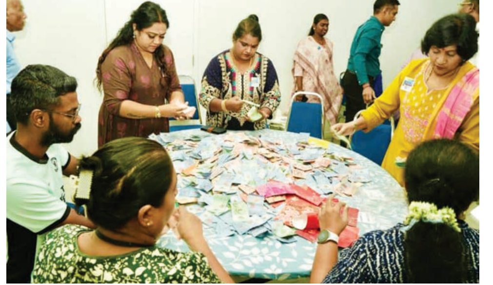
தைப்பூச நன்கொடை கணக்கெடுப்பு நிகழ்ச்சியில் அரசு மற்றும் அரசு சாரா நிறுவனங்களைச் சேர்ந்த தன்னார்வாலர்கள் கலந்து கொண்டனர்.

நிர்வகிப்பதில் வெளிப்படைத்தன்மை மற்றும் நேர்மையின் முக்கியத்துவத்தை வலியுறுத்தினார்.