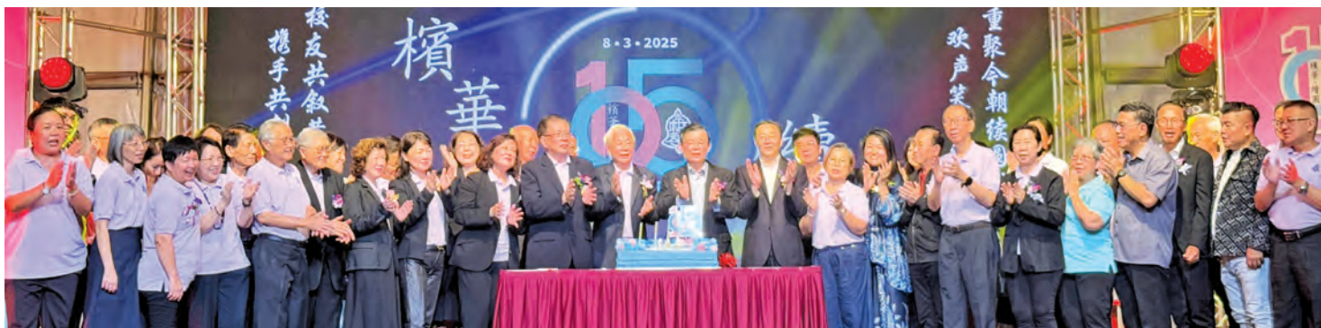
槟华创校105周年纪念晚宴上，全体嘉宾共切喜糕，场面欢愉。