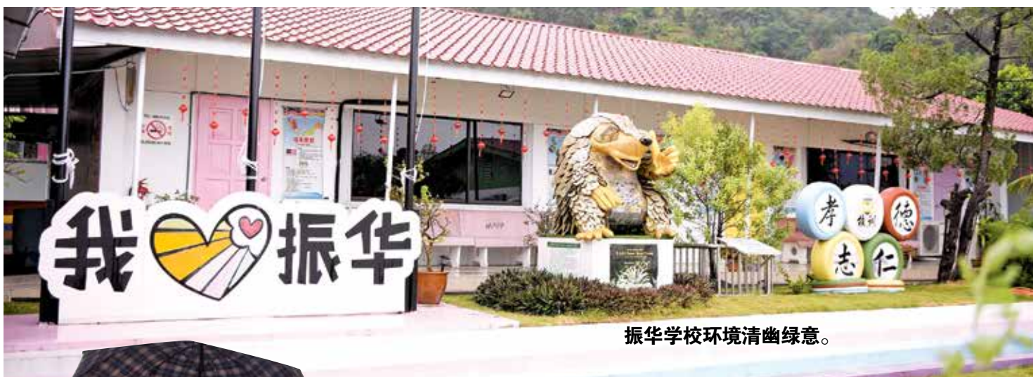
振华学校环境清幽绿意。