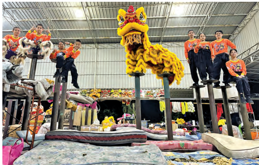
团员每周都会安排4天晚间进行训练，每次训练两小时以上。

“舞狮训练常会锣鼓喧天，难免会打扰到附近邻里；2009年我们的训练馆因发生火灾付之一炬，重建时在协会前辈的建议下搬迁到此处。”