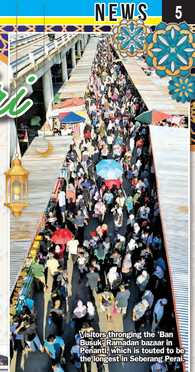
Visitors thronging the 'Ban Busuk' Ramadan bazaar in Penanti, which is touted to be the longest in Seberang Perai.

Buletin Mutiara wishes all our readers Selamat Hari Raya Aidilfitri.