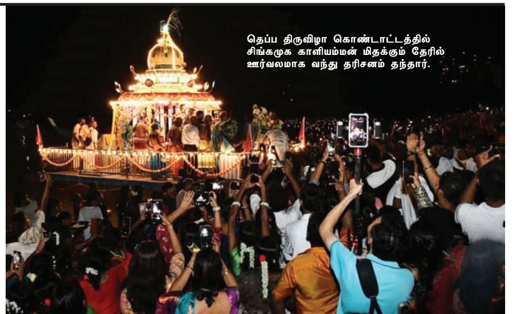
தெப்ப திருவிழா கொண்டாட்டத்தில் சிங்கமுக காளியம்மன் மிதக்கும் தேரில் ஊர்வலமாக வந்து தரிசனம் தந்தார்.

மிதக்கும் தேரை இரு படகுகள் மூலம் இழுத்தவாறு கடலின் ஒரு பகுதிக்குக் கொண்டு சென்று மீண்டும் அத்தெப்பத்தில் பவனி வந்த அம்மனை ஆலயத்திற்கு