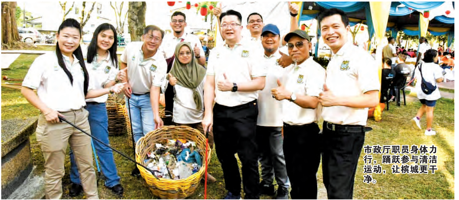
市政厅职员身体力行，踊跃参与清洁运动，让槟城更干净。

维护。” 在州政府与民间组织配合及努力下，古迹建筑物目前维护情况良好，宗祠、会馆可持续举办活动及吸引游客前来参观，一些传统手艺人也可以继续留在市内经营，让乔治市保持活力及人气满满。