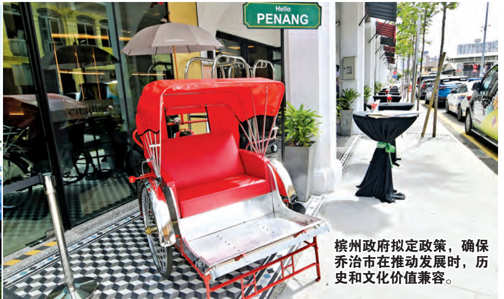
槟州政府拟定政策，确保乔治市在推动发展时，历史和文化价值兼容。