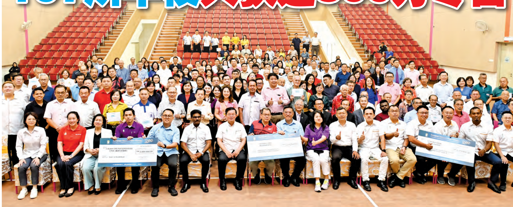
槟州政府2025年华小、华中及独中制度化拨款模拟支票移交仪式出席者合影。

槟州政府2025年华小、华中及独中制度化拨款模拟支票移交仪式日前举行,共发放809万3000令吉予107所华校,今年仪式首次移师到益华小学新校舍举行,增添特殊意义。