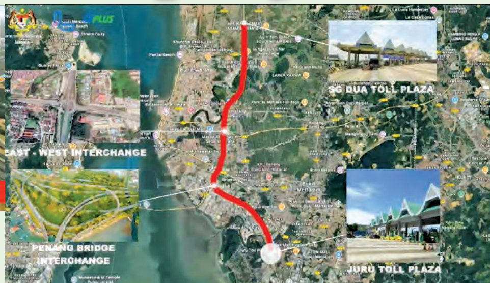
Map highlighting the affected areas under the project.

need for traffic lights, ensuring a seamless flow of vehicles,” he said, expressing hope the project would help ease congestion at the signalised intersection near Jalan Kebun Nenas, Bukit Tengah.