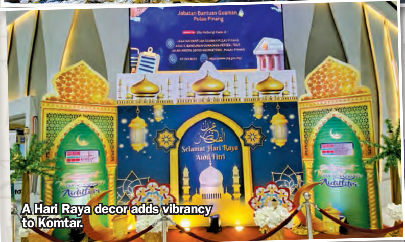
A Hari Raya decor adds vibrancy to Komtar.