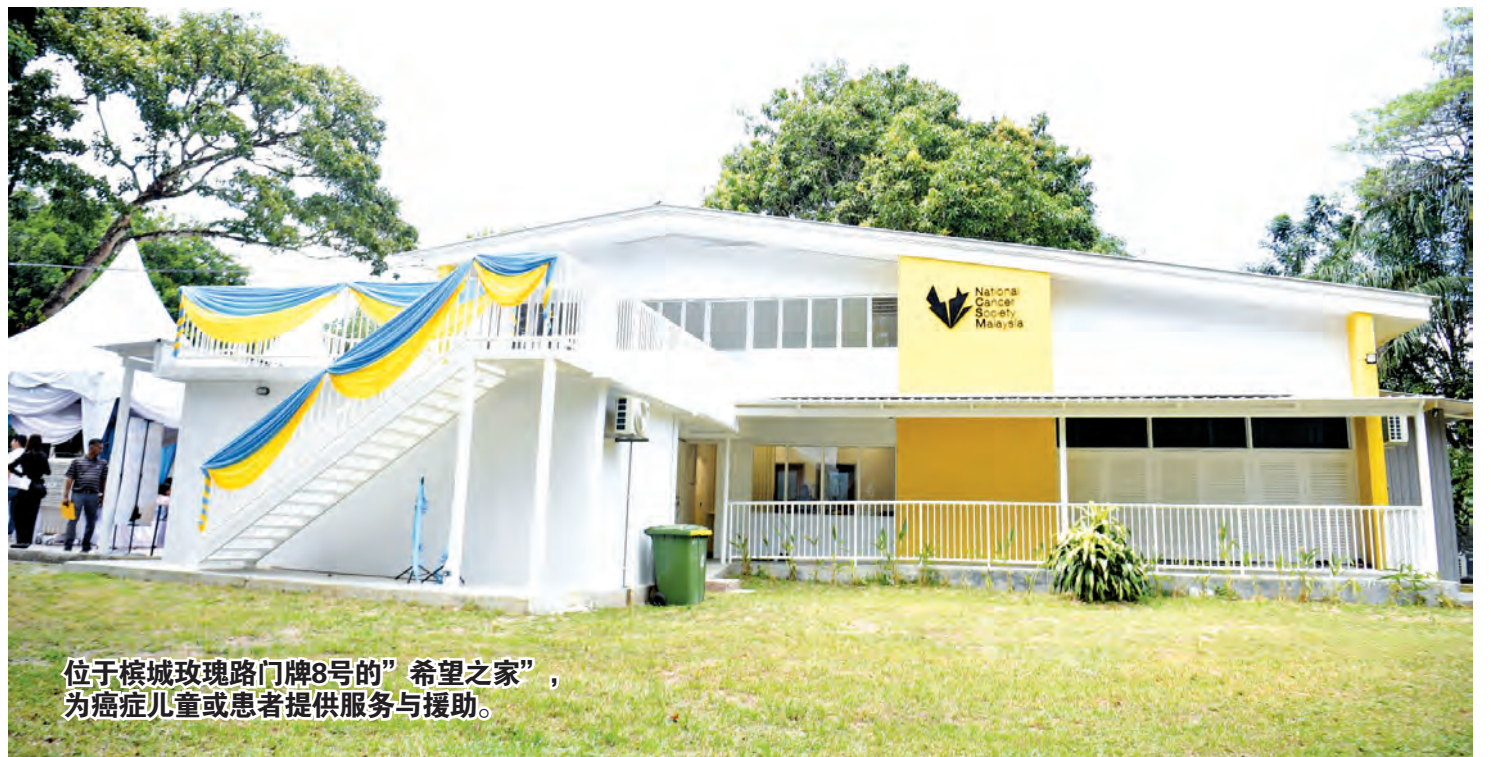
位于槟城玫瑰路门牌8号的“希望之家”，为癌症儿童或患者提供服务与援助。