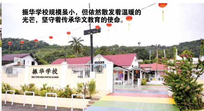
振华学校规模虽小，但依然散发着温暖的光芒，坚守着传承华文教育的使命。