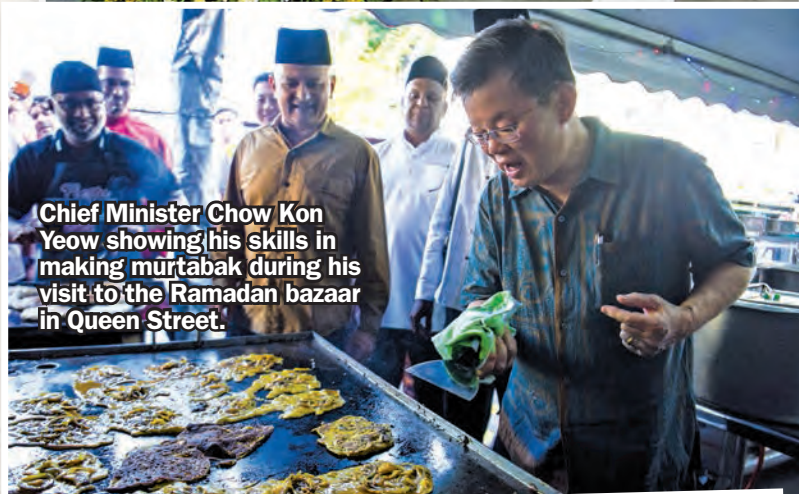
Chief Minister Chow Kon Yeow showing his skills in making murtabak during his visit to the Ramadan bazaar in Queen Street.