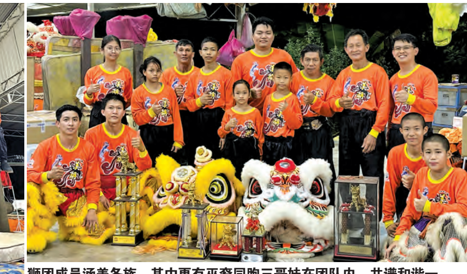
狮团成员涵盖各族，其中更有巫裔同胞三哥妹在团队内，共谱和谐一幕。