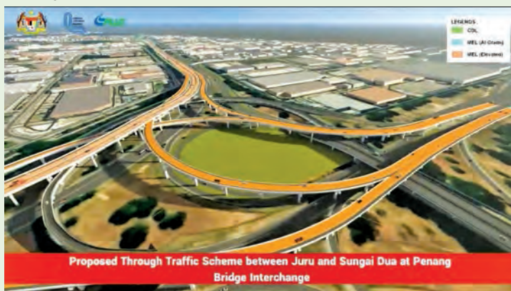
Proposed Through Traffic Scheme between Juru and Sungai Dua at Penang Bridge Interchange

“The approach involves constructing two elevated U-turns, eliminating the