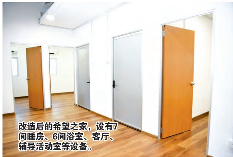
改造后的希望之家，设有7间睡房、6间浴室、客厅、辅导活动室等设备。

两层楼建筑，设有7间睡房，设有14张床、6间浴室、客厅、辅导室、活动室等设备。这项计划同时也获得大马房地产发展商公会（REHDA）、大马建筑师公会、大马工程时协会、城市规划师协会、大马特许测量师协会，以及各界善心人士的支持。