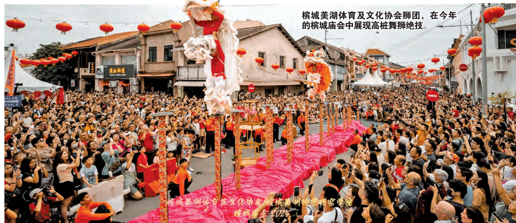
槟城美湖体育及文化协会狮团，在今年的槟城庙会中展现高桩舞狮绝技。