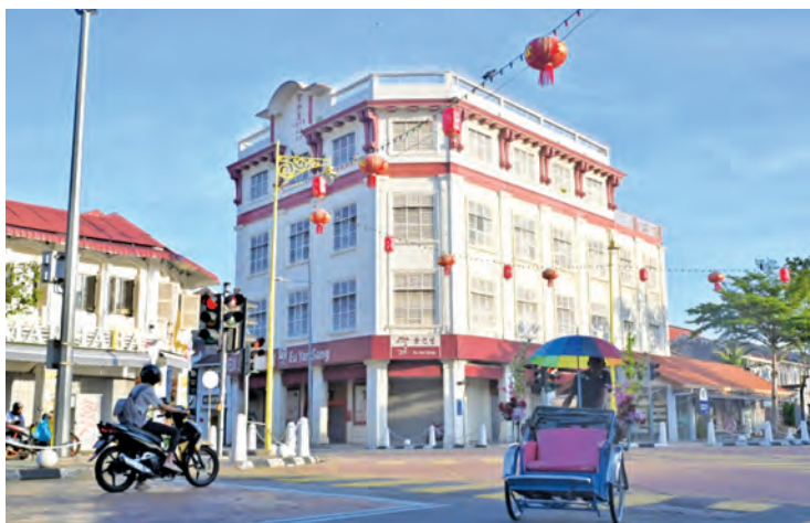
乔治市古迹区保存完好的百年建筑，吸引游客前来探索。

“新酒店的不断涌现，不仅提升了槟城的整体接待能力，也提供了更具吸引力的住宿体验，使得国际游客在槟城的旅程更加舒适与难忘。高品质的酒店设施、贴心的服务及别具一格的文化氛围，让槟城在全球旅游版图上的竞争力更上一层楼，促使更多旅客选择槟城作为首选目的地，进一步推动整体旅游业的繁荣。”