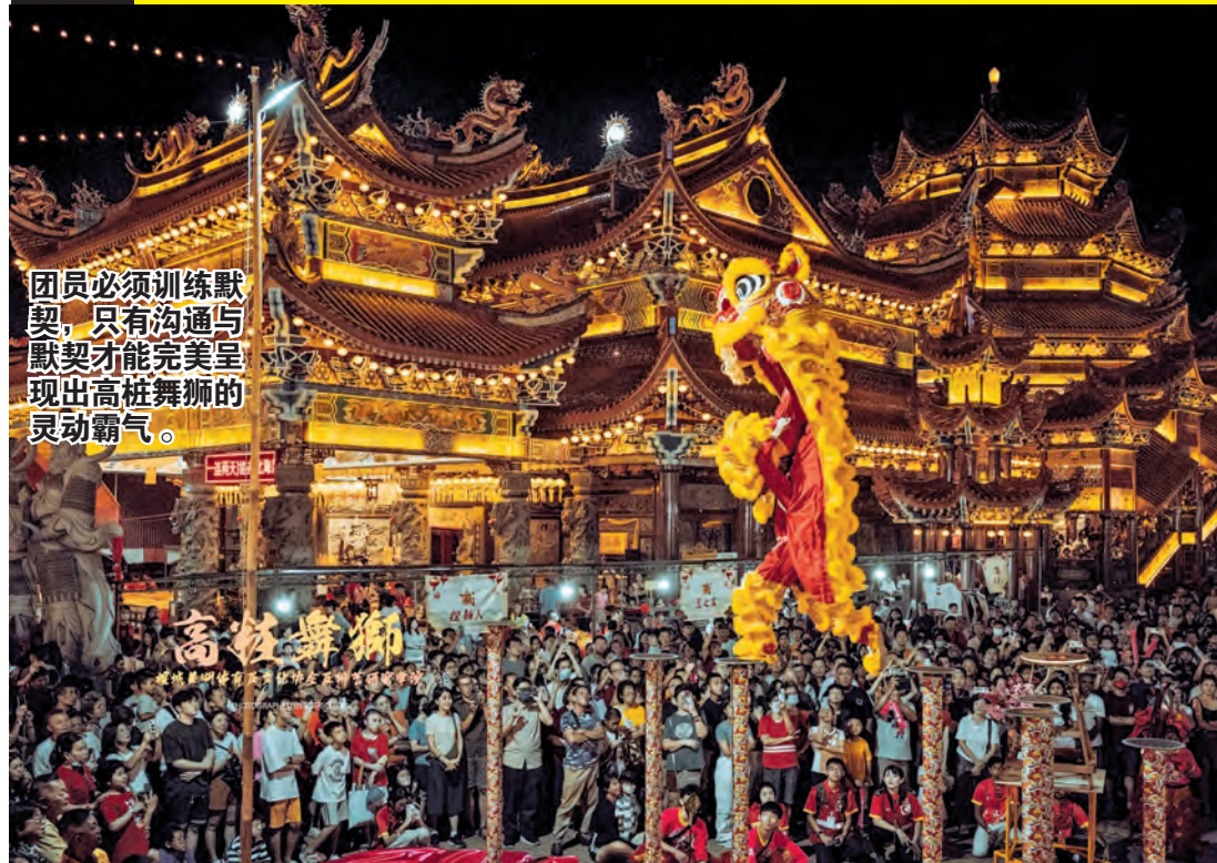
团员必须训练默契，只有沟通与默契才能完美呈现出高桩舞狮的灵动霸气。