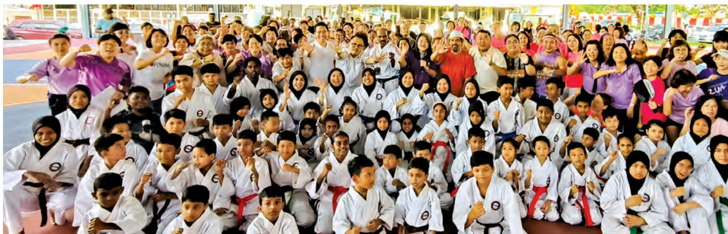
双溪槟榔区有盖篮球场设备提升、匹克球场启用礼兼妇女节庆典出席者大合照。

果各区有相关的体育设备建议或需求，作为青年与体育委员会，我们将积极倾听各方意见，并与民间运动团体保持紧密合作，希望可以尽我们最