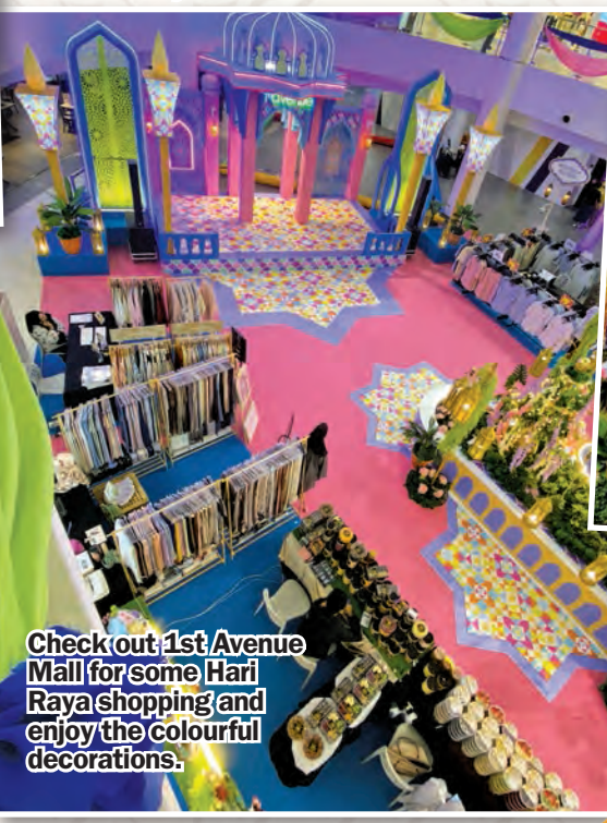
Check out 1st Avenue Mall for some Hari Raya shopping and enjoy the colourful decorations.