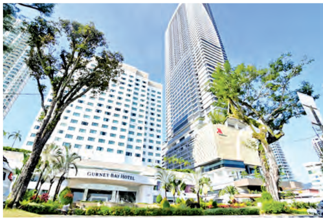
葛尼湾数间酒店符合国际水准，可满足国际高档市场需求。