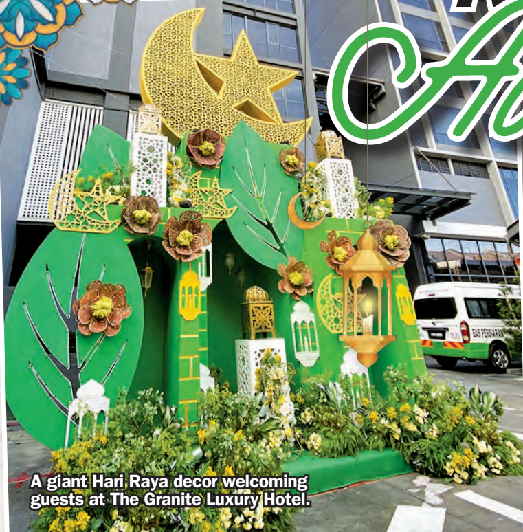
A giant Hari Raya decor welcoming guests at The Granite Luxury Hotel.

W ITH the holy month of Ramadan already into its final days, Muslims everywhere would have started shopping and preparing for Hari Raya Aidilfitri.