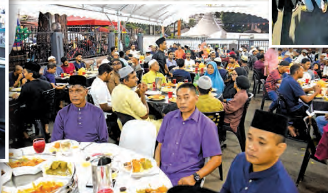
▲ The guests enjoying the buka puasa event, organised by the Jelutong parliament constituency service centre together with Persatuan Kebajikan Masyarakat Sejahtera Pulau Pinang and Jawatankuasa Kariah Masjid Jamek Hashim Yahya, Jalan Perak, at Masjid Jamek Hashim Yahya.