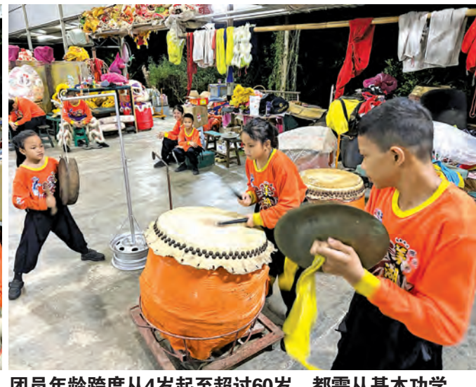
团员年龄跨度从4岁起至超过60岁，都需从基本功学起。