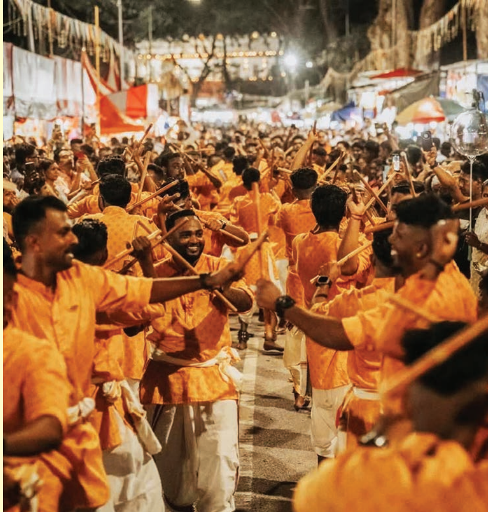
2025-ஆம் ஆண்டு தைப்பூசக் கொண்டாட்டத்தில் வாட்டர்ஃபோல் கோலாட்டக் குழுவினரின் படைப்பைக் காணலாம்.

இருந்து தொடங்கிய வரலாறு இன்னும் ஆராய்ச்சி செய்யப்பட்டு வருகிறது.