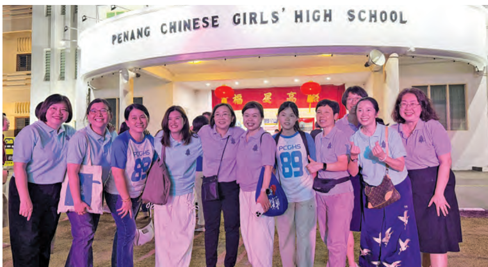
校友们在母校前开心合影。