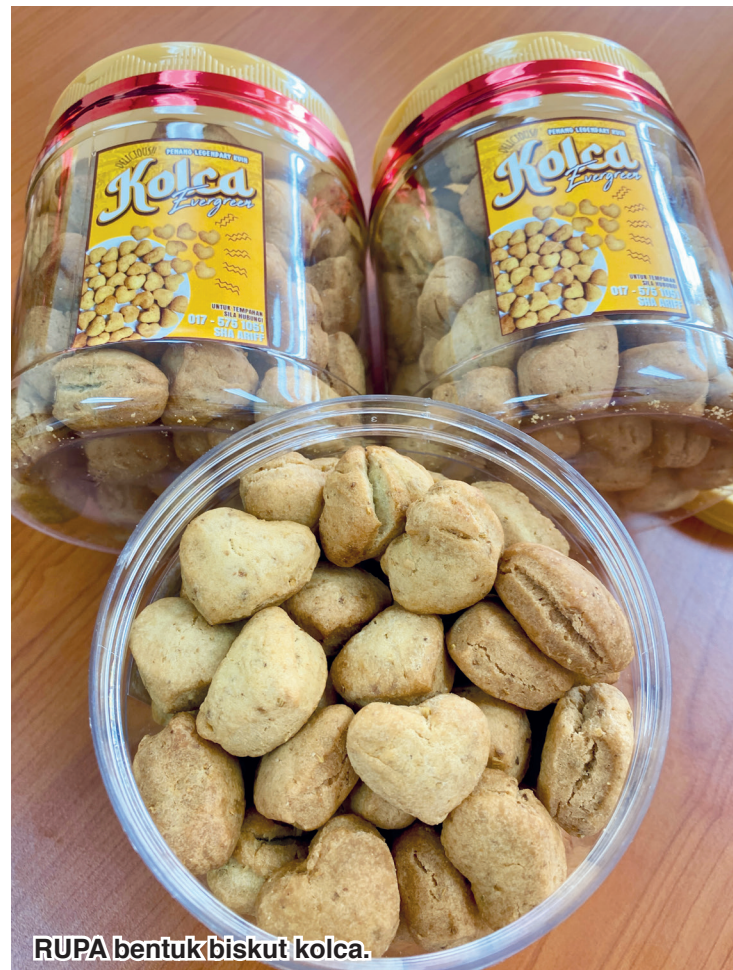
RUPA bentuk biskut kolca.

"Ada juga pelanggan kami yang menempah biskut kolca untuk dibawa ke luar negara," ujarnya yang merupakan ibu