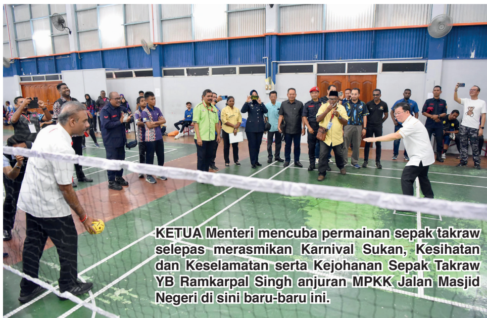
KETUA Menteri mencuba permainan sepak takraw selepas merasmikan Karnival Sukan, Kesihatan dan Keselamatan serta Kejohanan Sepak Takraw YB Ramkarpal Singh anjuran MPKK Jalan Masjid Negeri di sini baru-baru ini.

"Kita telah menyaksikan begitu banyak kejayaan yang diraih di negeri Pulau Pinang hasil kerjasama di antara Kerajaan Negeri dengan pelbagai pihak termasuk agensi negeri serta Persekutuan, badan-badan bukan kerajaan (NGO) dan organisasi pada peringkat akar umbi," katanya sambil menzahirkan penghargaan kepada MKPP Jalan