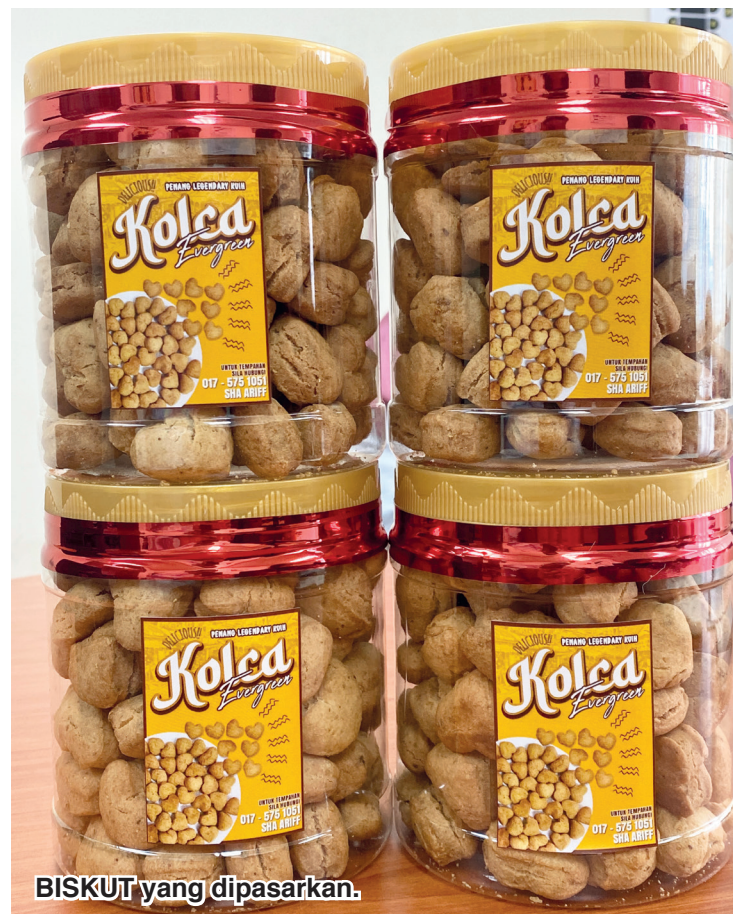
BISKUT yang dipasarkan.