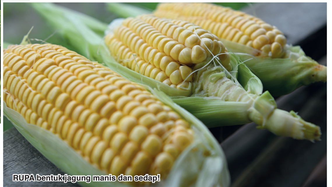
RUPA bentuk jagung manis dan sedap!

P ANDEMIK COVID-19 yang tidak disangka-sangka terjadi pada tahun 2020 sedikit banyak menjejaskan pelbagai sektor ekonomi rakyat.