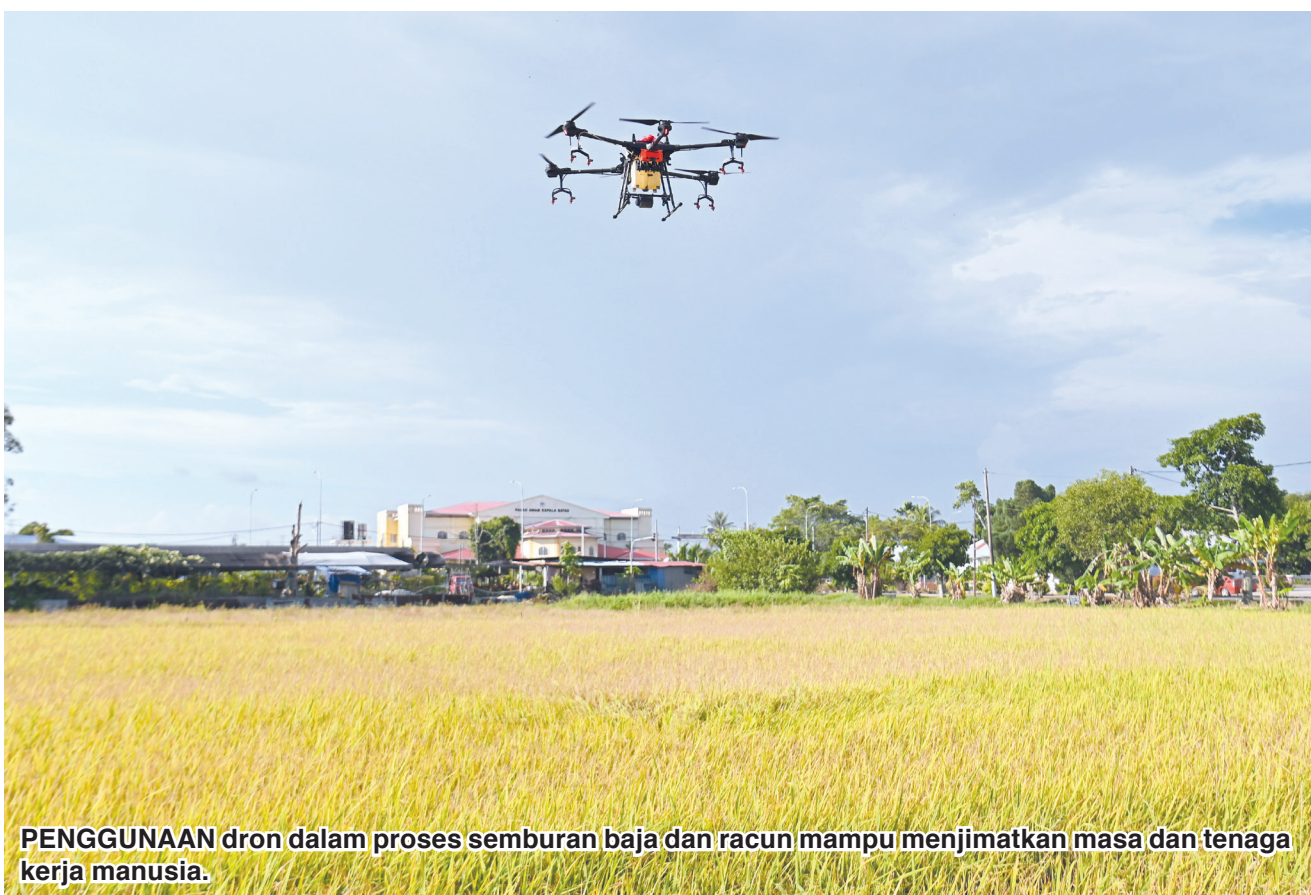
PENGUNAAN dron dalam proses semburan baja dan racun mampu menjimatkan masa dan tenaga kerja manusia.

Mengulas lanjut, Fahmi memaklumkan bahawa pihaknya telah mengemukakan permohonan peruntukan