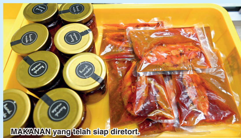
MAKANAN yang telah siap diretort.

"Terima kasih juga kepada suami dan keluarga yang banyak memberikan sokongan serta bantuan untuk memastikan produk sambal penyet ikan Talang Mamazola semakin dikenali," katanya mengakhiri bicara.