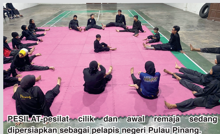
PESILAT-pesilat cilik dan awal remaja sedang dipersiapkan sebagai pelapis negeri Pulau Pinang.

dilaksanakan lebih lancar sekiranya penyaluran dana dapat disalurkan untuk perbanyakkan tempat latihan, fasiliti, pengambilan jurulatih-jurulatih muda dan jangan sekat kemasukan di sekolah," tambahnya.