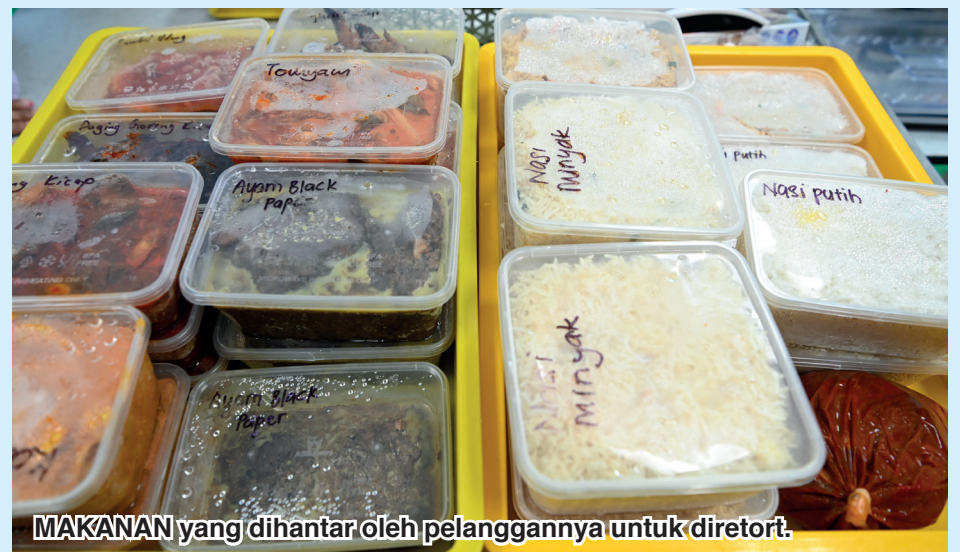
MAKANAN yang dihantar oleh pelanggannya untuk diretort.