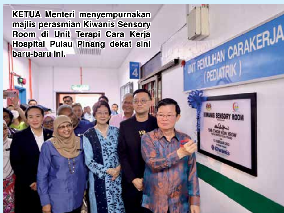
KETUA Menteri menyempurnakan majlis perasmian Kiwanis Sensory Room di Unit Terapi Cara Kerja Hospital Pulau Pinang dekat sini baru-baru ini.

dipenuhi tetapi saya bersyukur kerana Kiwanis Club of Penang Central melihat sedikit daripada keperluan-keperluan besar ini (iaitu keperluan kemudahan terapi cara lebih berkualiti di HPP).