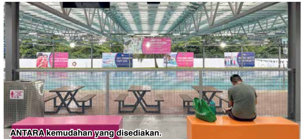
ANTARA kemudahan yang disediakan.

"Usaha ini adalah bertepatan dengan Tema A Visi Penang2030 iaitu meningkatkan daya huni bagi menambah baik kualiti kehidupan, khususnya di bawah inisiatif strategik A4,