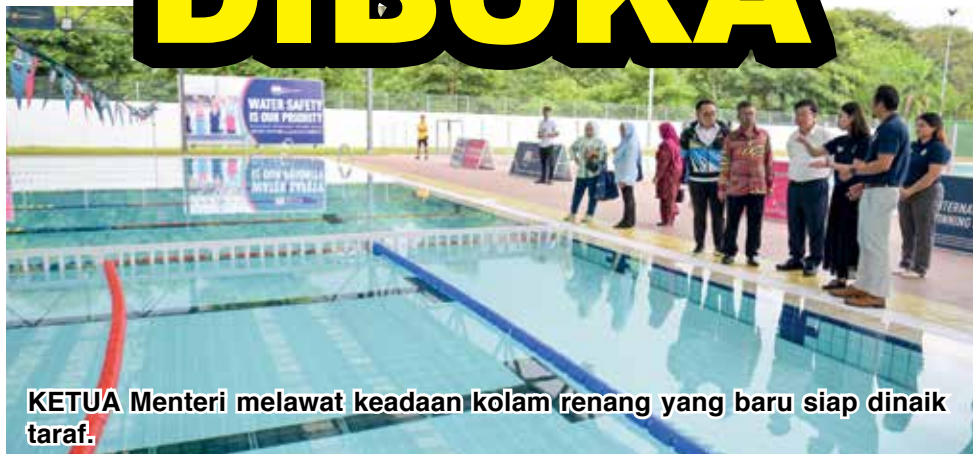
KETUA Menteri melawat keadaan kolam renang yang baru siap dinaik taraf.