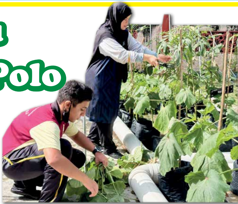
PROJEK tanaman yang didedahkan kepada para pelajar.