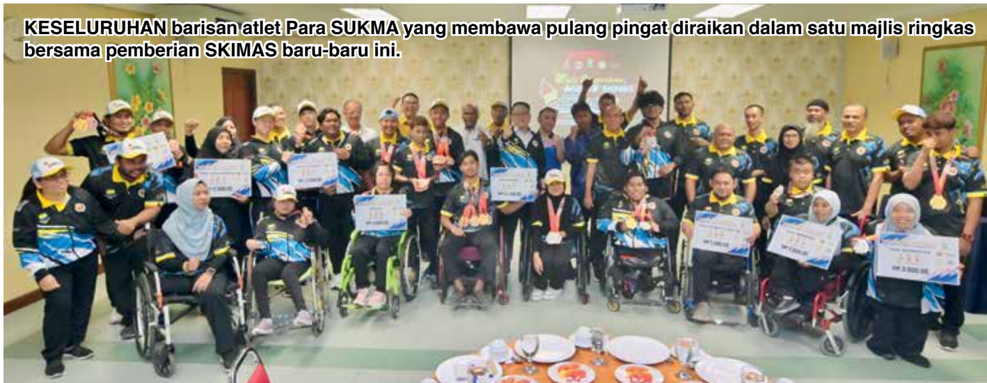
KESELURUHAN barisan atlet Para SUKMA yang membawa pulang pingat diraikan dalam satu majlis ringkas bersama pemberian SKIMAS baru-baru ini.

“Ini akan menjadi dorongan kepada saya untuk melakar lebih banyak kejayaan selepas ini walaupun buat pertama kali bertanding dalam Para SUKMA.