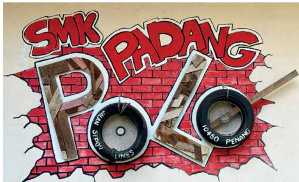
HASIL seni kreatif menggunakan barangan kitar semula.

“Antara aktiviti yang dijalankan adalah mencuci kereta, mengurus dan mengamalkan gaya hidup berlandaskan hijau, edaran risalah di setiap kelas, pemantauan bil elektrik dan penganjuran kuiz serta gotong-royong setiap bulan.