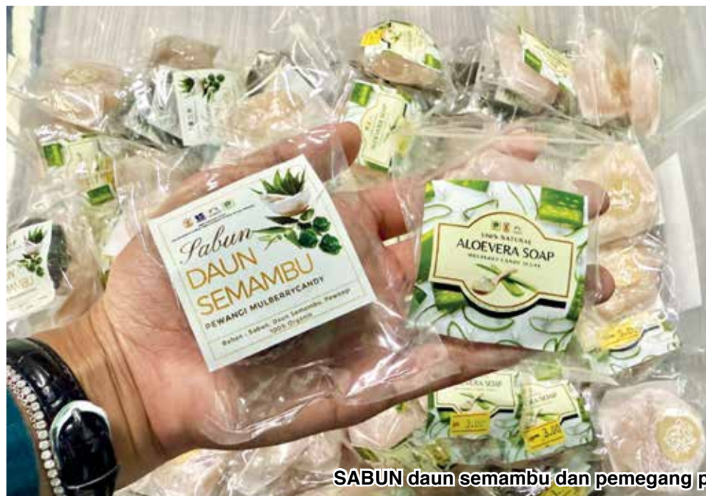
SABUN daun semambu dan pemegang pen yang dihasilkan daripada barangan kitar semula.