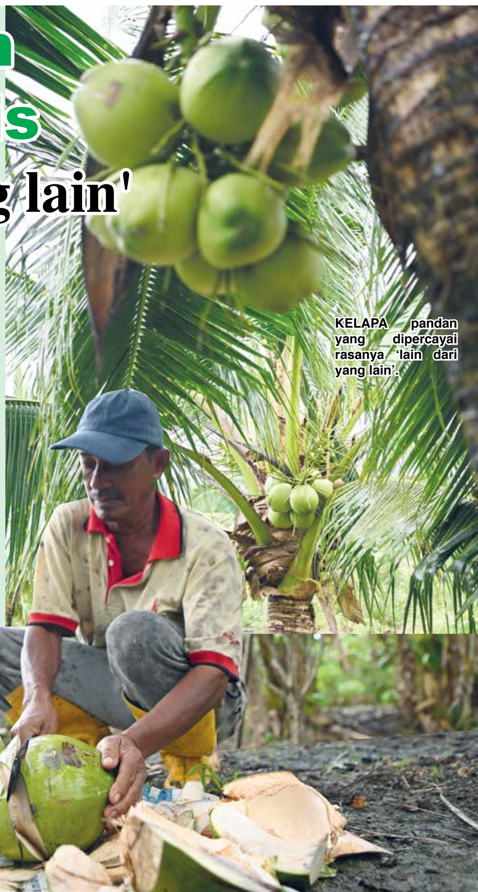
KELAPA pandan yang dipercayai rasanya 'lain dari yang lain'.

"Ancaman lain, adalah kera sampai para peladang terpaksa membiarkan anjing yang tak bertuan berkeliaran di