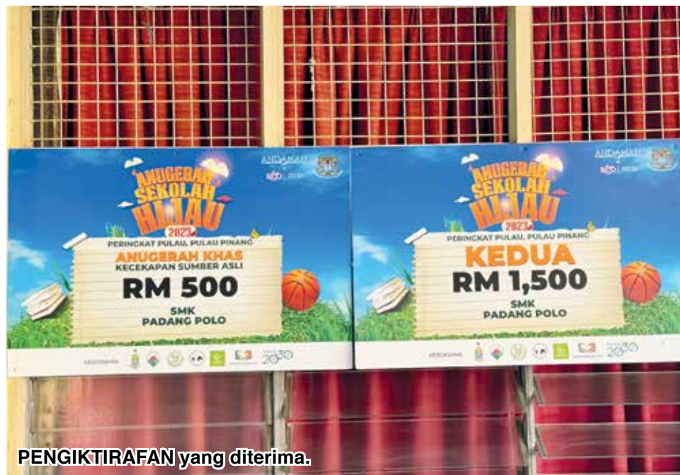
PENGIKTIRAFAN yang diterima.