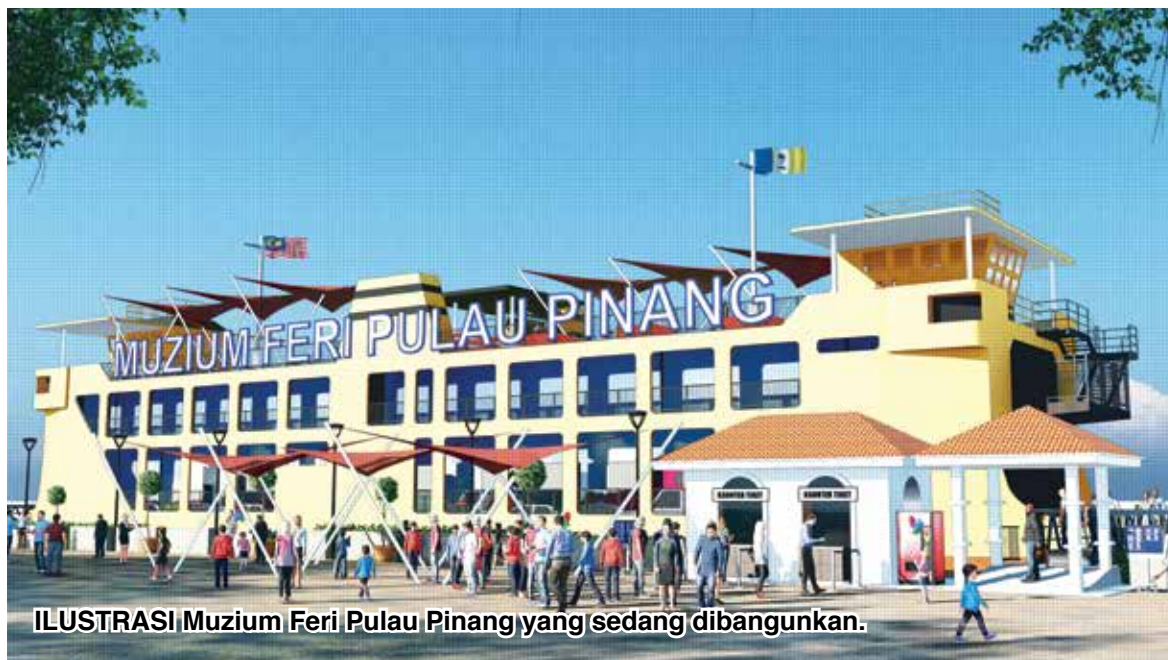
ILUSTRASI Muzium Feri Pulau Pinang yang sedang dibangunkan.

“Terdapat juga cenderamata feri yang direka khas untuk dibawa pulang,” jelasnya.