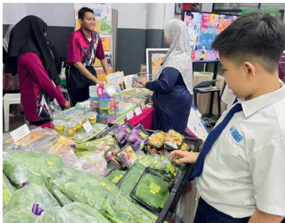
JUALAN hasil tanaman yang diusahakan.