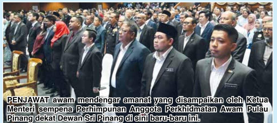
PENJAWAT awam mendengar amanat yang disampaikan oleh Ketua Menteri sempena Perhimpunan Anggota Perkhidmatan Awam Pulau Pinang dekat Dewan Sri Pinang di sini baru-baru ini.

"Saya percaya hasil yang dicapai daripada inisiatif berkaitan akan memberikan memberikan manfaat kepada semua pihak," ujarnya.