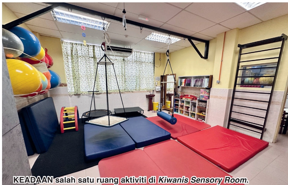
KEADAAN salah satu ruang aktiviti di Kiwanis Sensory Room .

“Saya ingin menyeru ibu bapa supaya cakna akan kebajikan pesakit, jika datang awal untuk merawat, pakar perubatan tahu apa yang boleh dilakukan kepada pesakit, jangan biarkan mereka keciciran dalam setiap aspek kehidupan,” katanya.