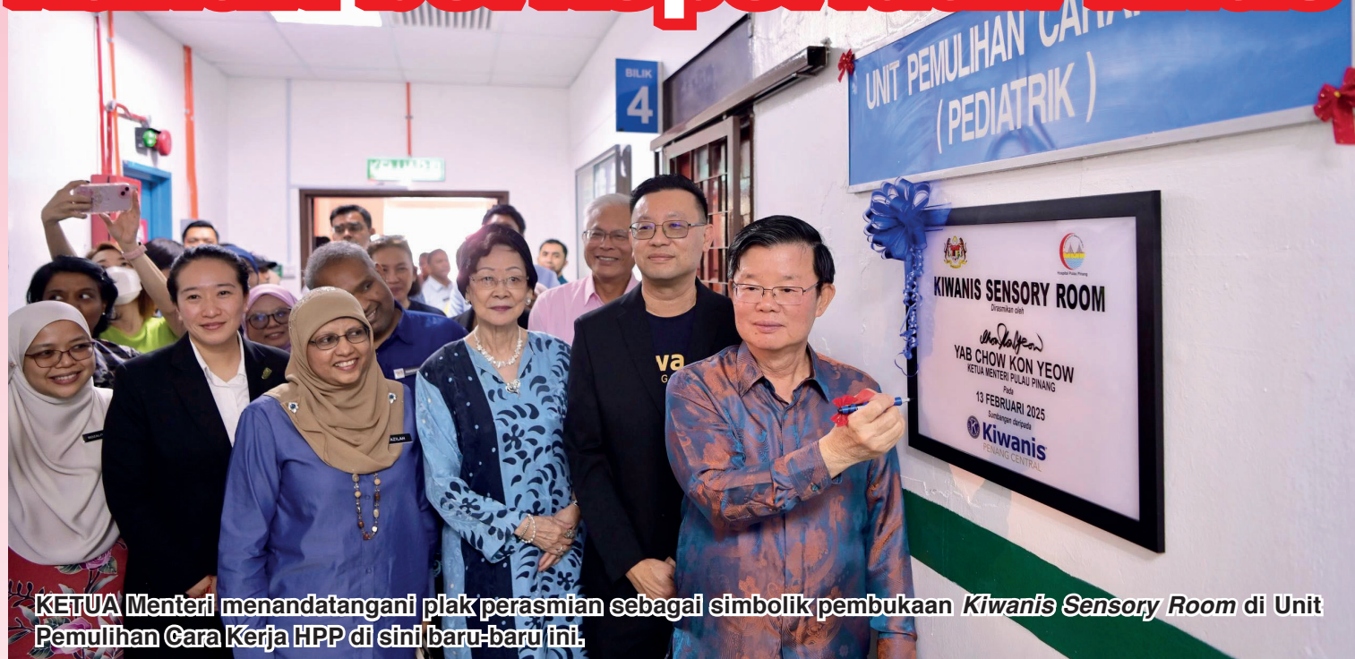
KETUA Menteri menandatangani plak perasmian sebagai simbolik pembukaan Kiwanis Sensory Room di Unit Pemulihan Cara Kerja HPP di sini baru-baru ini.

Susulan itu, bagi mengetahui lebih lanjut mengenai Kiwanis Sensory Room , barisan pakar