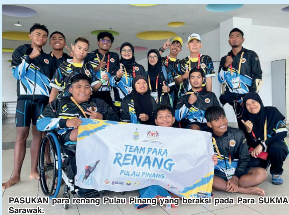
PASUKAN para renang Pulau Pinang yang beraksi pada Para SUKMA Sarawak.