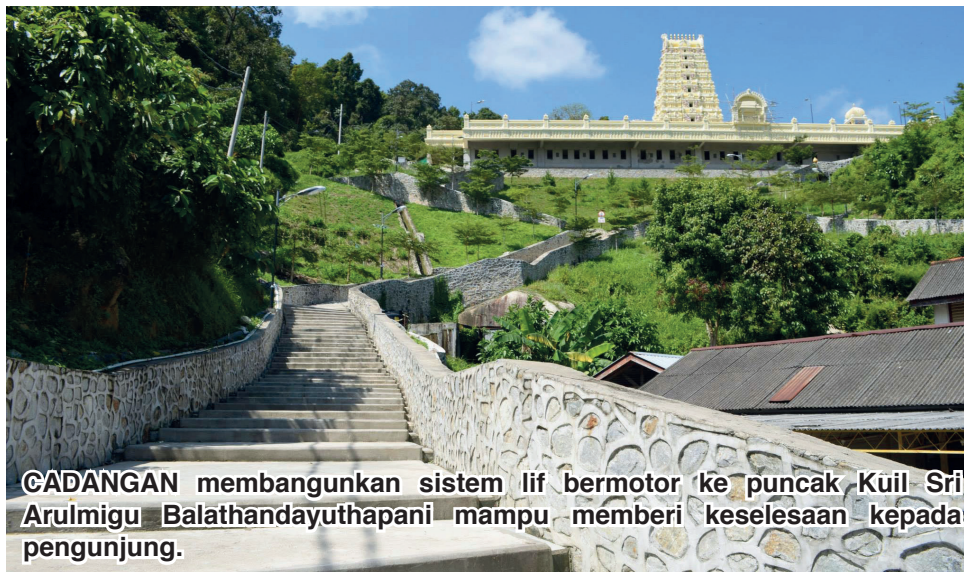
CADANGAN membangunkan sistem lif bermotor ke puncak Kuil Sri Arulmigu Balathandayuthapani mampu memberi keselesaan kepada pengunjung.

“Terletak pada ketinggian lebih 100 meter, usaha ini sudah pastinya akan meningkatkan nilai inklusif pada aspek kebebasan serta keupayaan beribadah yang akan dapat memberi manfaat kepada pihak yang lebih memerlukan seperti warga emas, orang kurang upaya (OKU), wanita hamil dan sebagainya,” jelasnya yang juga Ahli Dewan Undangan Negeri (ADUN) Padang Kota merangkap Ahli Parlimen Batu Kawan