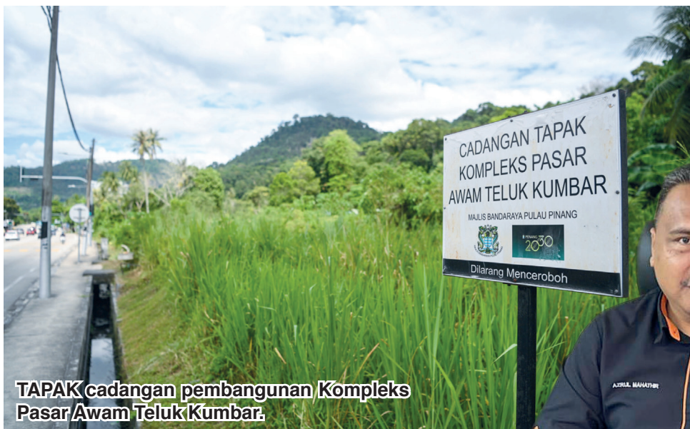
TAPAK cadangan pembangunan Kompleks Pasar Awam Teluk Kumbar.

“Projek (pembinaan kompleks pasar) tersebut adalah salah satu inisiatif pembangunan infrastruktur yang sangat