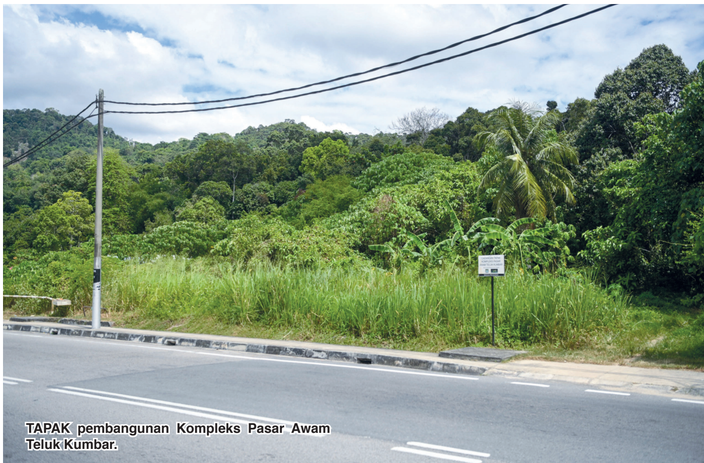
TAPAK pembangunan Kompleks Pasar Awam Teluk Kumbar.