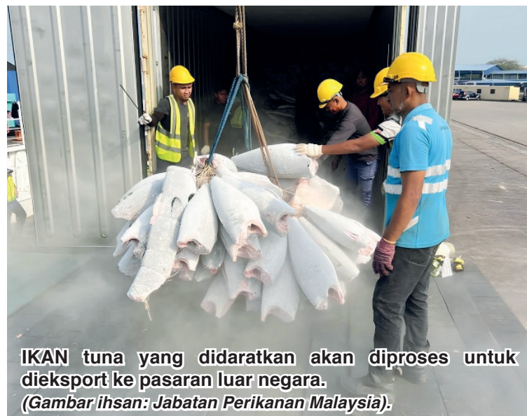
IKAN tuna yang didaratkan akan diproses untuk diekspor ke pasaran luar negara.