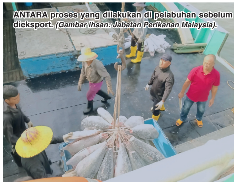
ANTARA proses yang dilakukan di pelabuhan sebelum diekspor.