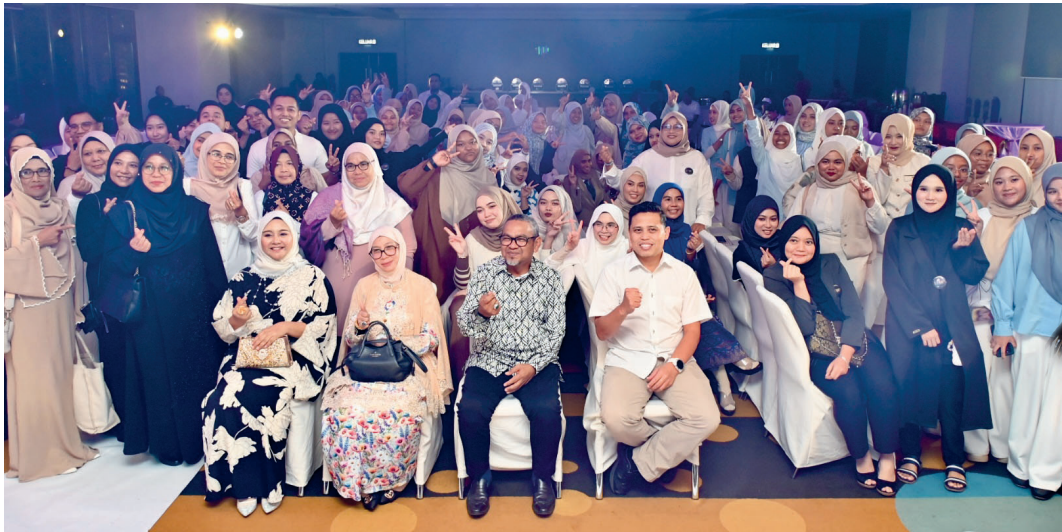
RAKAMAN gambar kenangan semua peserta berserta barisan jemputan.