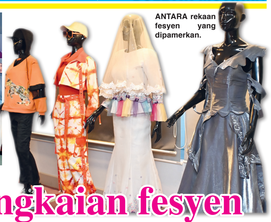
ANTARA rekaan fesyen yang dipamerkan.