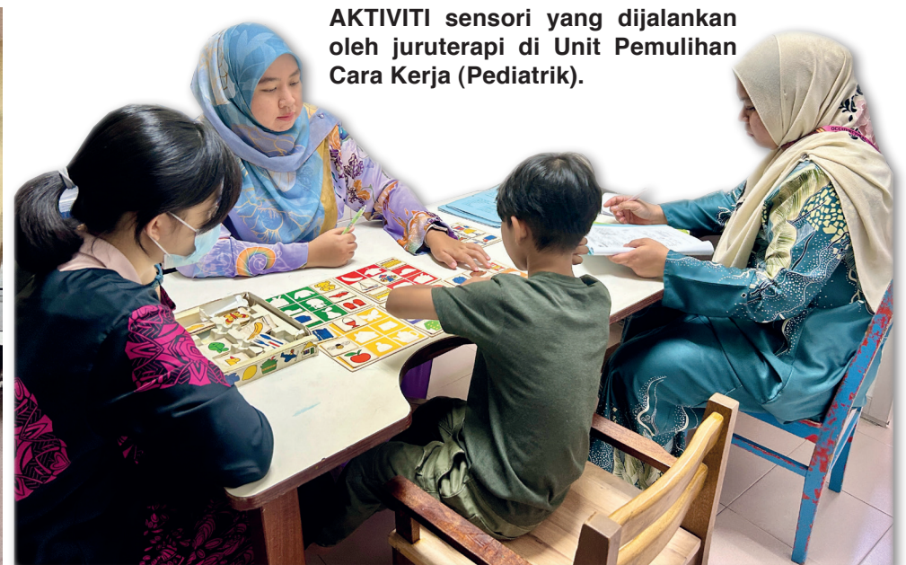
AKTIVITI sensori yang dijalankan oleh juruterapi di Unit Pemulihan Cara Kerja (Pediatrik).